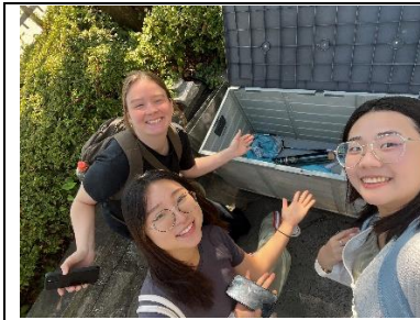
分組尋找校園指定物