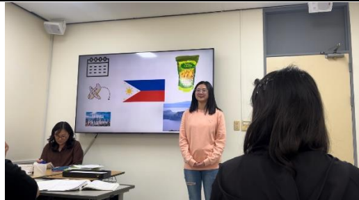
上台進行口語考試

我在語學堂的課程進一步提升了韓文的聽說讀寫能力。老師全程用韓語授課，剛開始上課時聽得非常吃力，但老師會事先解釋課程內容，並且對於遇到的問題總是熱心幫助。每天都有作業，小考則包含口試和寫作，班上同學大約有十五位，老師會確保每位同學都能回答問題並理解內容後，再繼續往下進行課程。語學堂的課程安排是每週一至週五，每天四小時，課程強調互動，讓我們能夠在實踐中學習和進步。