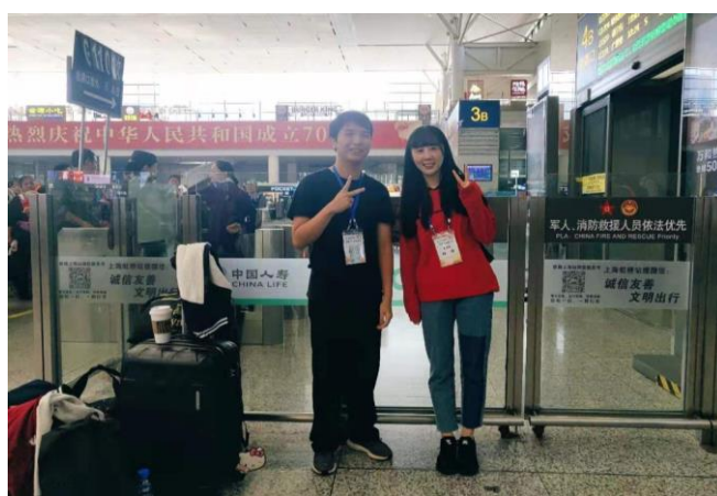
2019 在滬台灣學生交流活動