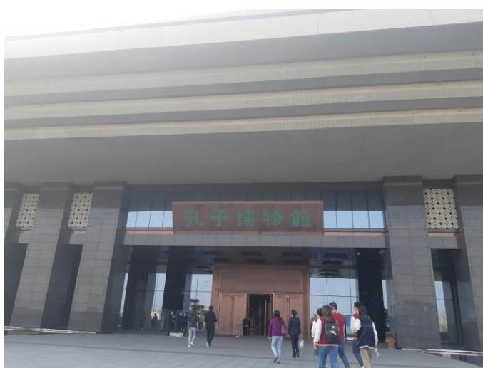
2019 在滬台灣學生交流活動