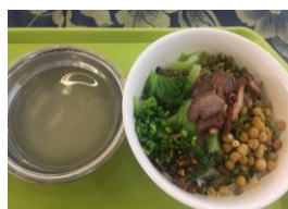
▲東苑二樓(桂林米粉)