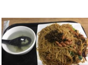
▲東北烤冷面、螺獅粉、螺公堂的炒螺獅粉、土家香醬餅(東門出去右手邊)