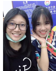
▲越南朋友(她當天有表演)