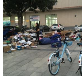
▲雙 11 的包裹