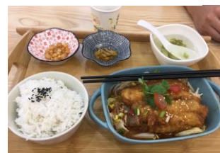
▲蘇先生烤魚飯(農院路)