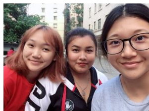
▲老挝(左)泰國(中)的朋友