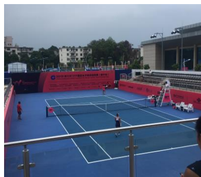
▲在網球中心的比賽