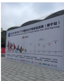
▲國際女子網球巡迴賽