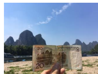
▲二十元人民幣風景圖