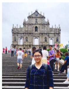
▲與澳門大三巴牌坊合影

6. 旅遊：轉機時在澳門玩幾個小時，九月底跟團去「桂林山水甲天下的，陽朔山水甲桂林」的桂林看風景，十二月自由行去貴州拜訪少數民族(侗、苗族)，其餘時間都是在南寧走走。