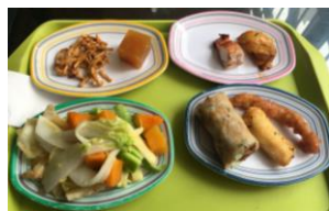
▲東苑二樓(自助秤重)