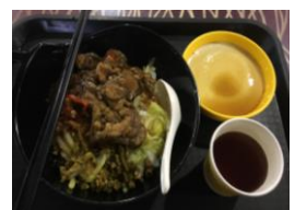
▲秀苑二樓(茄子肉末飯)