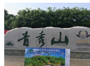
▲南寧 5A 國家級景區的青秀山