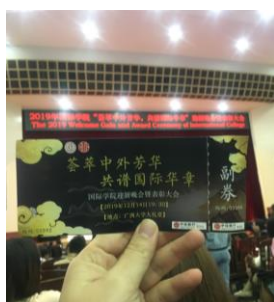
▲國際學院迎新晚會