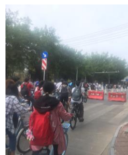
▲尖峰時間塞車情形

結構力學跟土力學，老師們上課主要以 PPT 為主，板書為輔。老師的講話速度很快，而且會有一點口音，但還是算標準的，講課速度也是滿快速，我的第一堂課(第三周)他們已經上到第三章了，這真的讓我驚慌，因為沒課本，他們的進度又很快，我又剛到新環境，還沒進入狀況，從開始上課到國慶七天連假都是屬於緊繃狀態，七天中用四天將前面所缺的看一看、做筆記，狀況才好一點。因為老師是用 PPT 上課，所以可以跟老師或同學要 PPT 檔案，作為複習或預習用。(注意各科的考試方式)