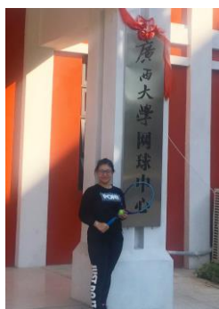
▲今年建好的網球中心

體育課的話，我是上網球，拍子跟球要自備(我是向學長借的)，當上第一堂課時已經是在第四周了，好險之前有打球運動神經還可以，還跟得上進度，因為留學生不用體測，所以老師說我也不用測(老師直接把我當留學生)，印象中女生的體測內容沒什麼變，在這邊男生的 1600 變 1000，但是還有一個「引體向上」。這次剛好很幸運 ITF 國際女子網球巡迴賽(南寧站)在西大舉辦，所以老師也趁這個機會帶我們去看球賽，是我人生中第一場網球賽呀！