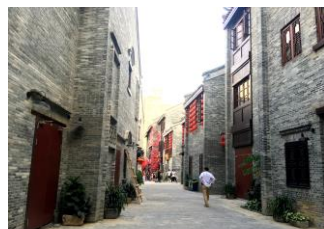
▲南寧朝陽廣場附近的三街兩巷