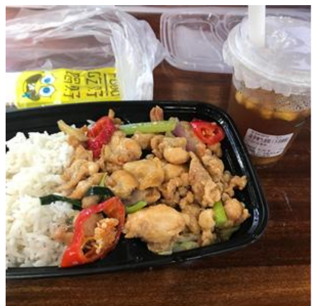
興安超市下食堂的蓋飯窗口