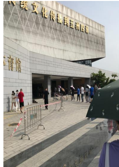
例行公事，排隊到體育館做核酸