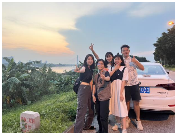
自駕遊真的很有趣!