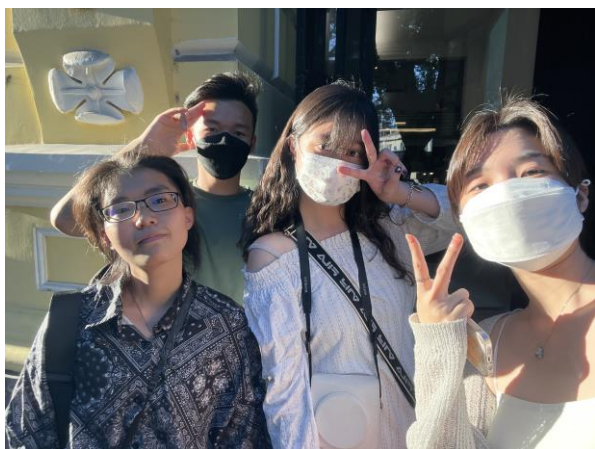
交換生一起到廣州沙面島