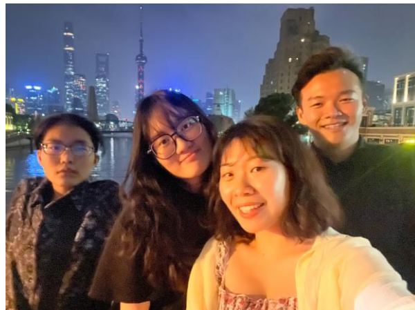
交換生一起跟東方明珠塔拍照