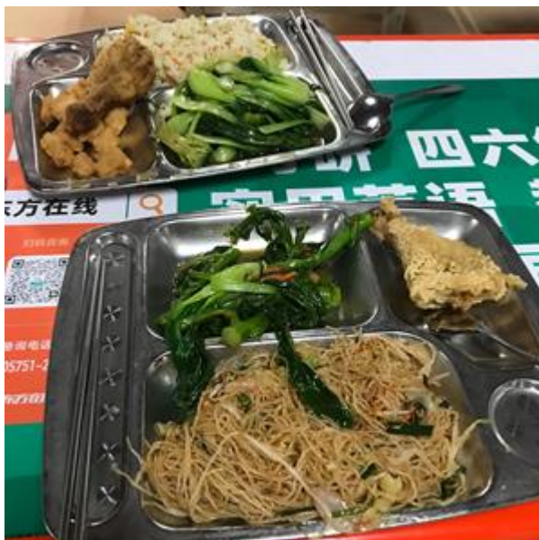
裕華堂二樓的宵夜窗口