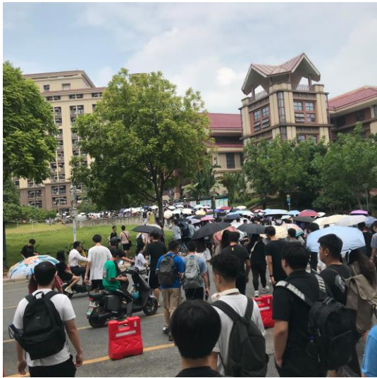
第四節下課時大家從教學樓蜂湧而出