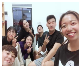
*與寮國朋友的合照