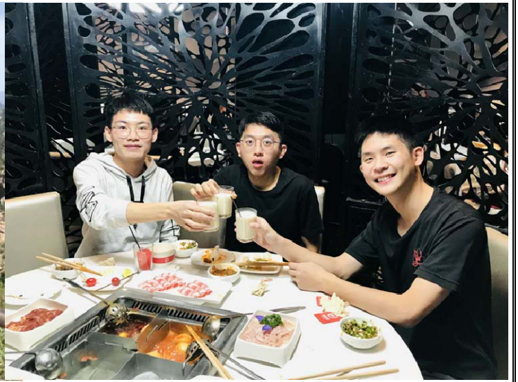
圖：跟朋友去海底撈

* 請於返國一個月內將本報告繳交至 rdincn@email.nqu.edu.tw