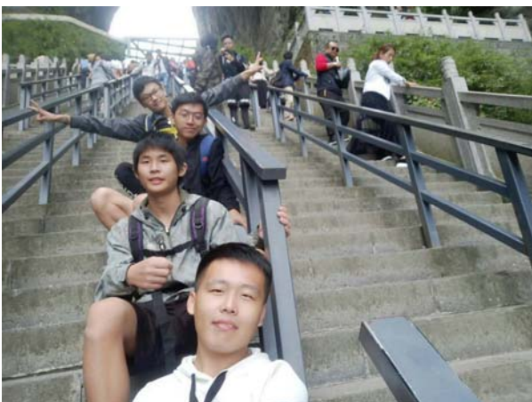
圖:和遇到的朋友在天門山國家公園合照