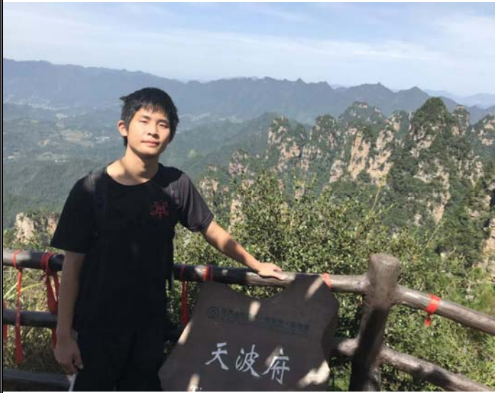
圖：張家界國家公園