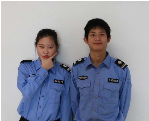
圖:跟劇社朋友拍戲照

這屆的很多交換生一開始都非常無助與茫然，包括完全不知道怎麼去南校區，我也是其中一人，我們總是喜歡自嘲猶如校園的幽靈一般虛無。要來暨大不要說要有心理準備，只是不要有期待會有什麼就好，學校方面是認真完全不管你，任何形式上的活動或幫助都不會主動給你，除非你去要求啦，雖無意冒犯，但暨大的交換生窗口回應你的有效性與速度要有心理準備，以免心裡有落差。不過我還是希望能提供最基本的資訊像如何前去校園，而不是只有過時的官網資訊。因此我跟其他朋友創了一個聯繫以後的交換生的群組，希望能幫助有志前往暨大交換的朋友，希望以後交換生都能傳遞經歷，減少不愉快的經驗，這也是我小小的希冀吧。也因此我的微信 ID 是 jesseoxox，有任何相關的問題都可以聯繫我(加好友請說明來意)，也祝福所有人能用盡資源來享受與體驗交換生活。