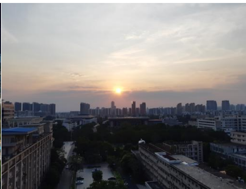
▲宿舍走廊看出去的景