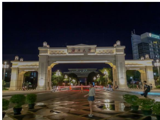
▲廣西大學正門(南門)

在北大只要自己做好安排都能很自在地到處跑，能在課餘時間在大陸旅遊，每一次的旅行都帶給許多美好的回憶。有想去的地方一定要趁這個好機會，好好享受交換時光吧！出門旅行記得帶好台胞證與學身證。