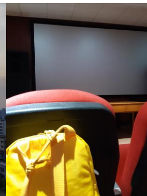
▲學校文學院內的小影院