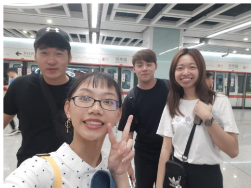
▲和學長姐們去北海