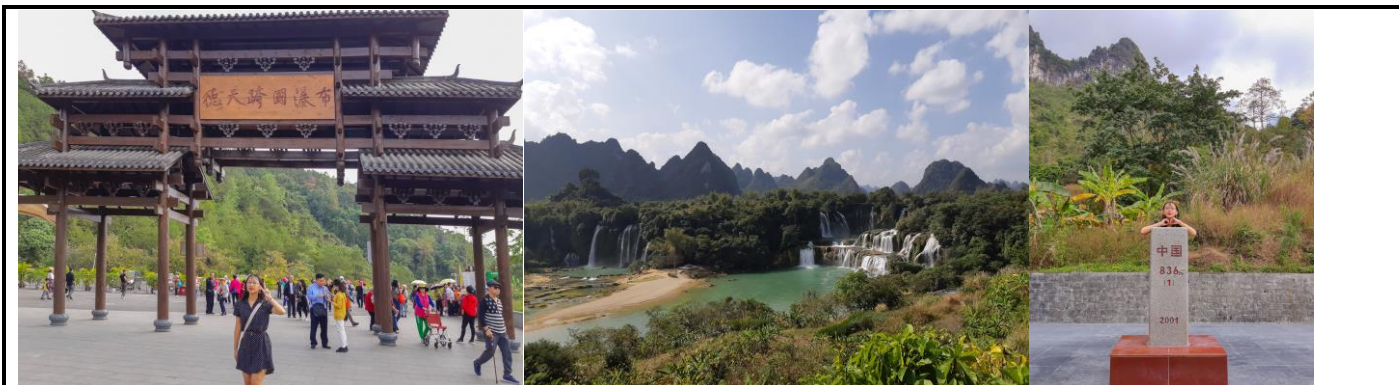
▲德天瀑布(短暫的跨境)▲