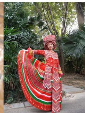
▲穿少數民族阿妹的服裝