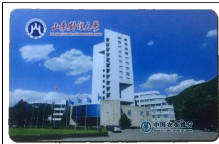
校園一卡通，也為圖書館借書證