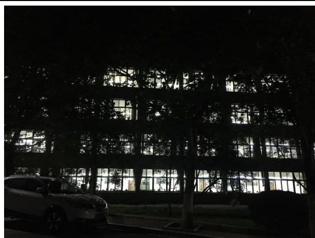
晚上 10 點燈火通明的教學樓，學生還在自習