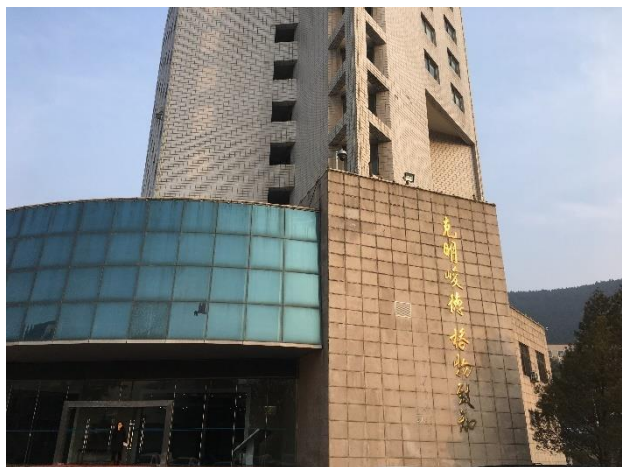
校訓「克明峻德 格物致知」