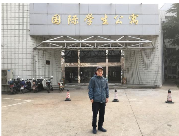
國際學生宿舍門口

舜耕校區-國際生宿舍，一個人 750RMB/月(含水電)。宿舍分別有單人、雙人和四人套房，男女混宿，無門禁，鑰匙為磁卡。房間非常寬敞基本配備都有，且免費提供床墊、床包、棉被、枕頭等一應俱全，房內也有冷暖氣，非常舒適。房內也有冷熱飲水機，但需自行叫水 12RMB/桶約 12 公升。宿舍內有廚房、餐廳、閱覽室、自習室、洗衣間(洗衣機 45 分鐘/3RMB、烘衣機 60 分鐘/5RMB)、交誼廳和桌球桌。