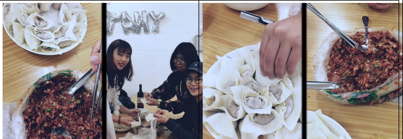
和中國朋友一起包餛飩