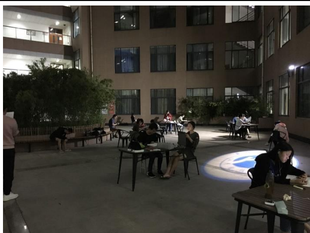
學生在教學樓廣場念書