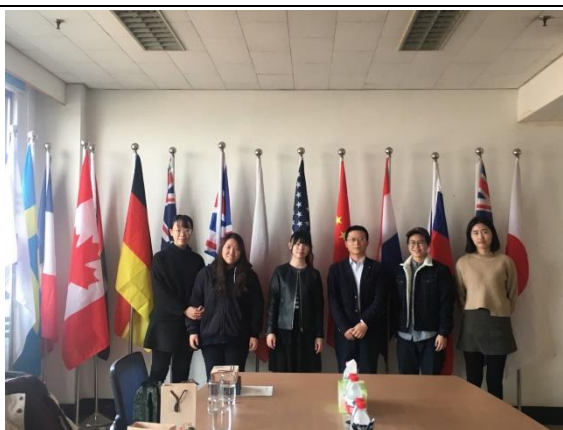
與山財大澳臺事務辦公室老師們合影

這次交換旅程將會是人生中最難以忘懷的經驗之一，這四個半月，我有許多不同經驗衝擊。雖然說著一樣的语言，既使相同詞彙但也擁有截然不同的意義。就像我們雖是同文同種，但有著不同背景。而這些差異將成為最特別的經驗。交換期間我去了 9 個省份、17 個城市，每個城市擁有自己最得特的印記，創造我最特別的記憶。在絲路之旅，做了 15 個小時硬臥列車，列車載著各地的人們，說著不同的方言、帶著不同目標前往相同的目的地。最後，非常謝謝山財大港澳臺事務辦公室老師們、學伴和同學們，在我剛到異地人生地不熟遇到困難時，竭盡全力替我們解決，讓我能有一個完美的經歷。