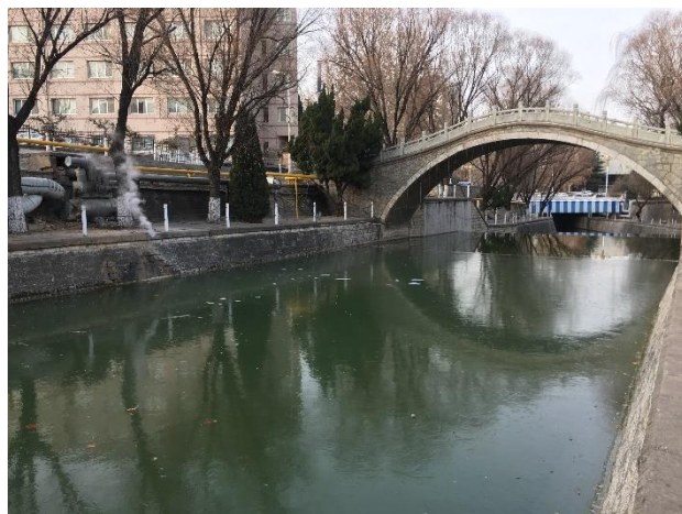
舜耕校區內的河流