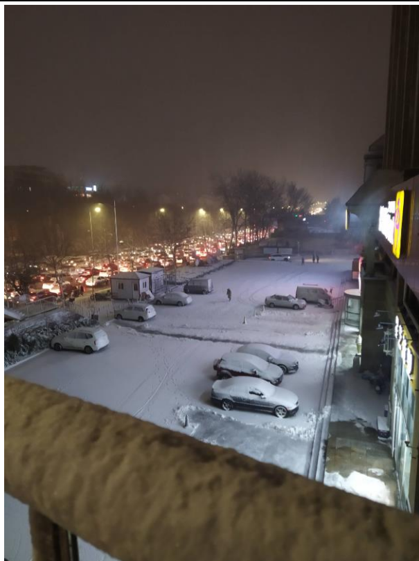
南北天橋旁的雪景