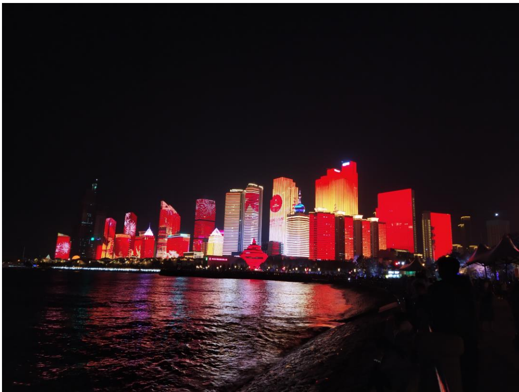
山東青島 建政七十周年的螢幕牆