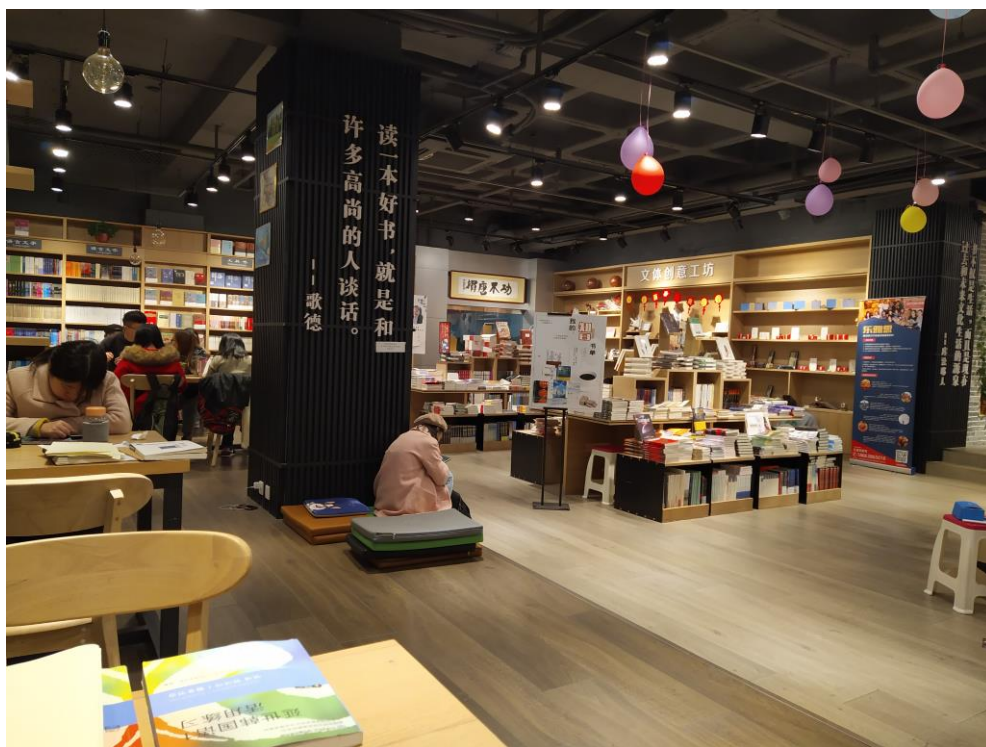
圖書館內的小書店