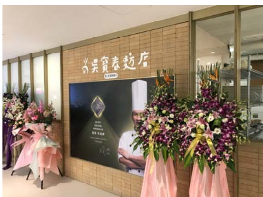
上海吳寶春麵包店