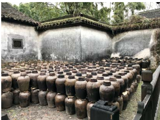
烏鎮東柵（三白酒文化館）