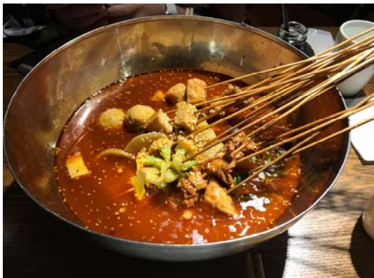
上海美食成都付小姐