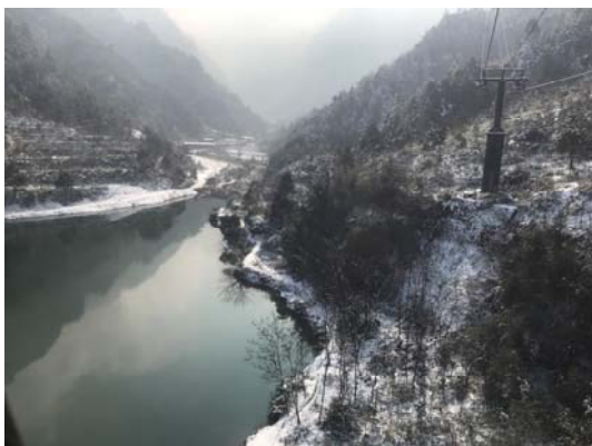
湖南張家界天門山山下景色