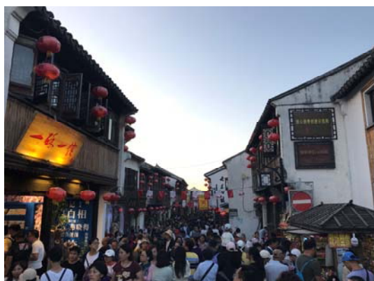
蘇州七里山塘古街