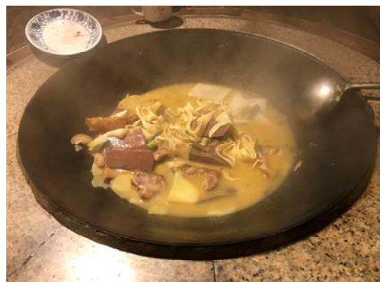
湖南張家界道地美食三下鍋