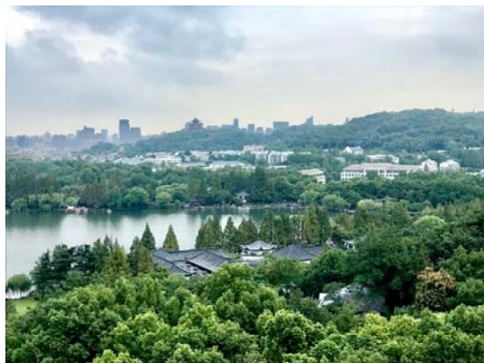
杭州雷峰塔上景色