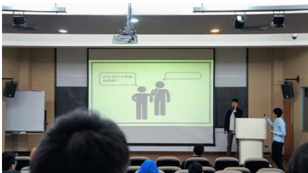
資工系期初大會系上分享

建議有機會申請交換生的金大生一定要去申請，趁著大學時期比較有空的時間，可以多到世界各地去走走，一定會對自己的眼界能夠更開闊，此外在年輕時候學習獨立、學習如何安排規劃行程出去玩，也是很好的練習及學習。