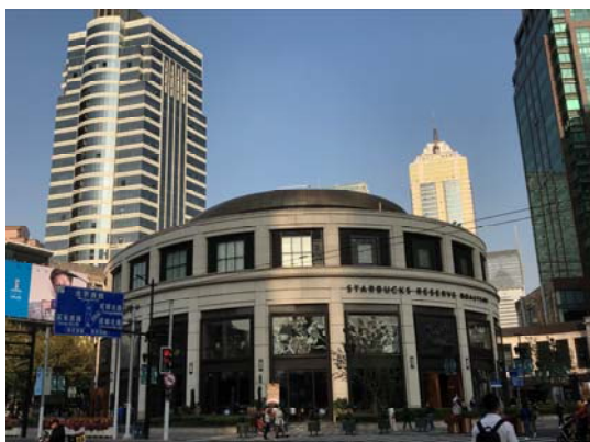
上海星巴克臻選烘焙坊（全世界最大）