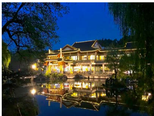
杭州夜晚湖邊景色