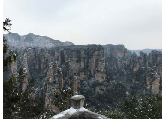
湖南張家界武陵源景區