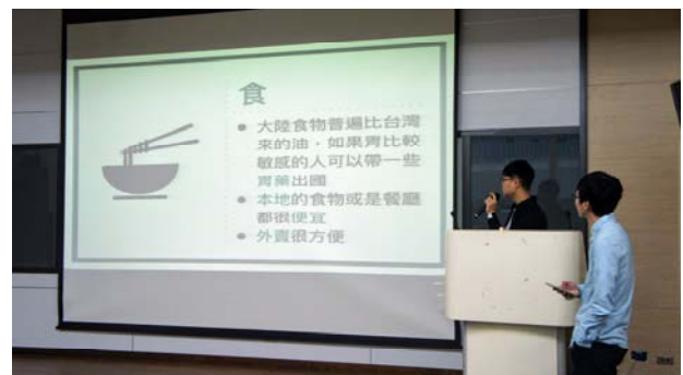
資工系期初大會系上分享

* 請於返國一個月內將本報告「電子檔」寄交 gatsby.kinmen@gmail.com