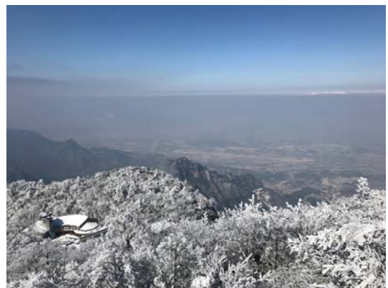
湖南張家界天門山山上景色