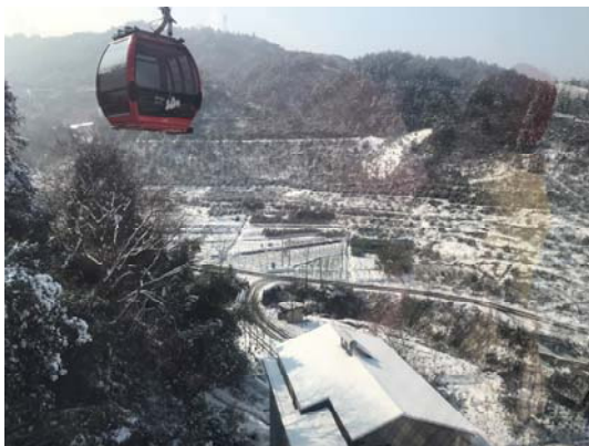
湖南張家界天門山