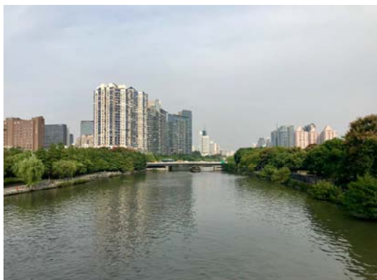
杭州好運杭州湖畔景色