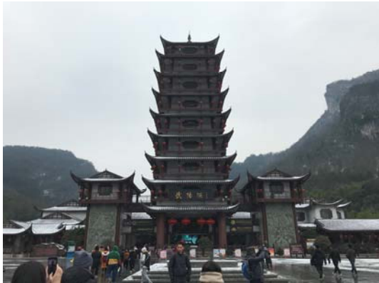
湖南張家界天子山