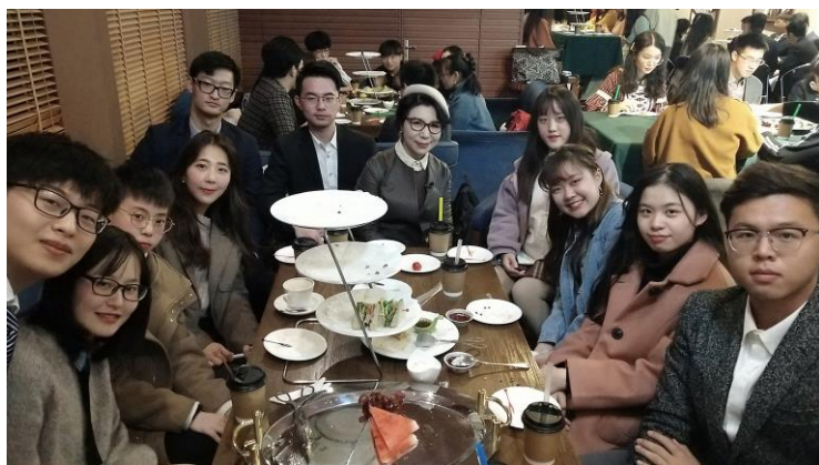
(圖：形象與禮儀課下午茶課)

其他旁聽課程包括物權法、法理學，主要是希望聆聽不同老師的授課方式以及兩地不同的法律體制比較。在這學期的課程中，不單單只是獲得課程知識的吸收，亦可深深感受到大陸學生的競爭力以及他們的積極度，當老師上課發問時，他們總能回答出具體答案或是做出相當有建設性的提問，讓我感受到自己的不足與缺點。