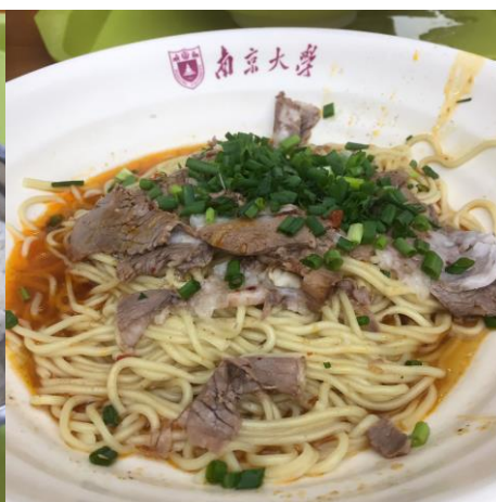
(圖：五食堂排隊羊肉麵)