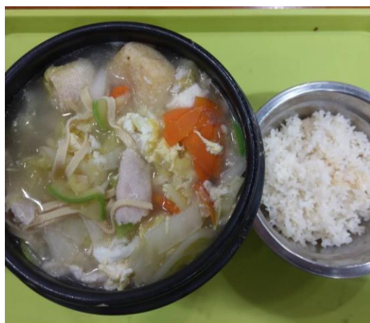
(圖：五食堂的營養湯)