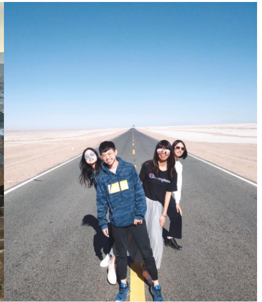
(圖：大西北最美公路)