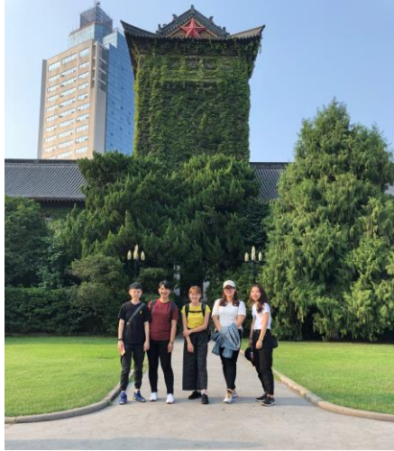
(圖：南京大學鼓樓校區)