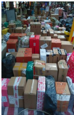
(圖：雙十一後快遞街盛況)