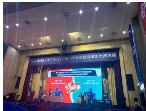
大學生模擬求職大賽