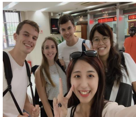
與外國朋友到銀行辦手續