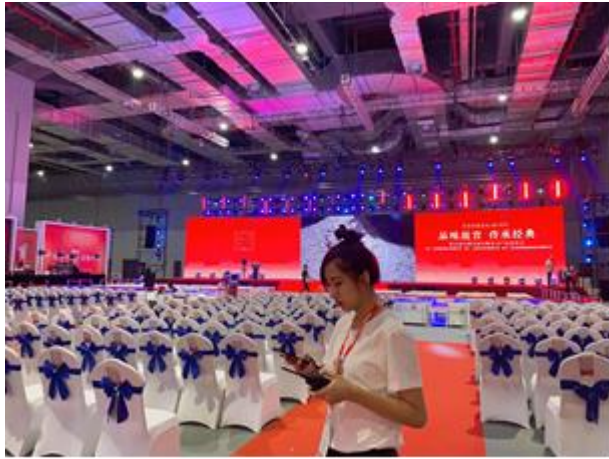
參加上海各種大型展會活動

課餘或連續假期時間，我會選擇踏上長途之旅，好好把握在中國的時光，踏上中國”大陸”之旅，在這期間除了在上海當地旅行外，也去了杭州、蘇州、岱山、西藏、寧波等等，天地有大美，要看過天與地的壯闊，才知道自己的渺小，走遍世界之美，那些縈繞心頭的芝麻小事在大自然眼前只是天際的一縷浮雲。出發之前跟學姊長們一直相信交換的本意並不是僅透過書本充實自己，而是靠著這珍貴的機會走過大山大海，相識四海朋友，走出學校「讀萬卷書，行萬里路」，用自己的雙眼及雙腳體驗文化的差異，令自己展開新的人生風景！