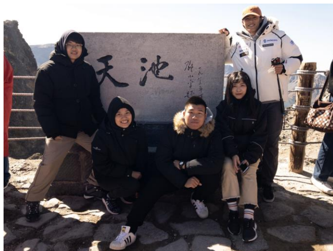
在長白山天池的合照