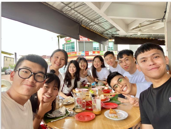
➤到居鑾找活動認識的朋友