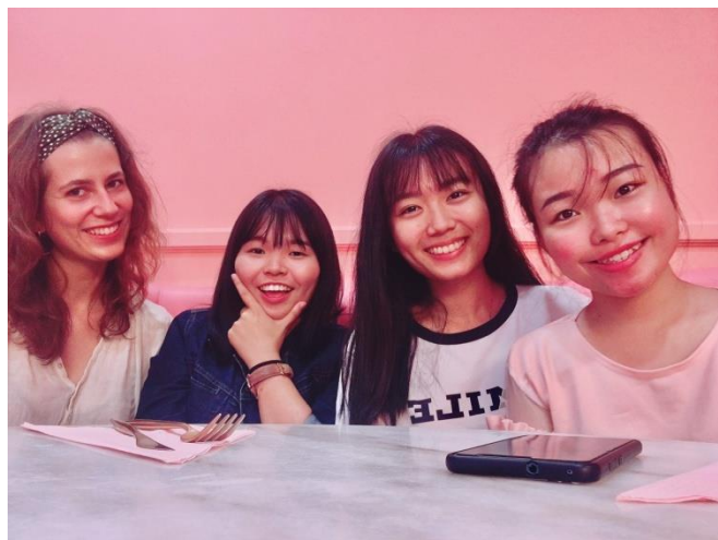
➤到檳城找活動認識的朋友