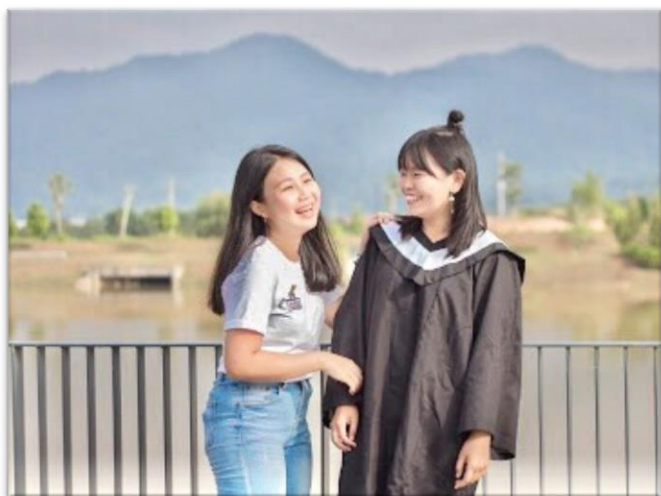
➤跟馬來西亞朋友拍畢業照