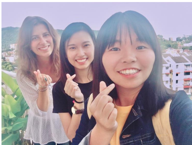
➤到檳城找活動認識的朋友