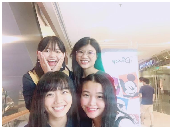
➤到檳城找活動認識的朋友