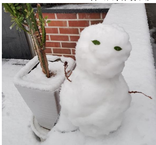
(2018 年的初雪，也是我第一次看雪)