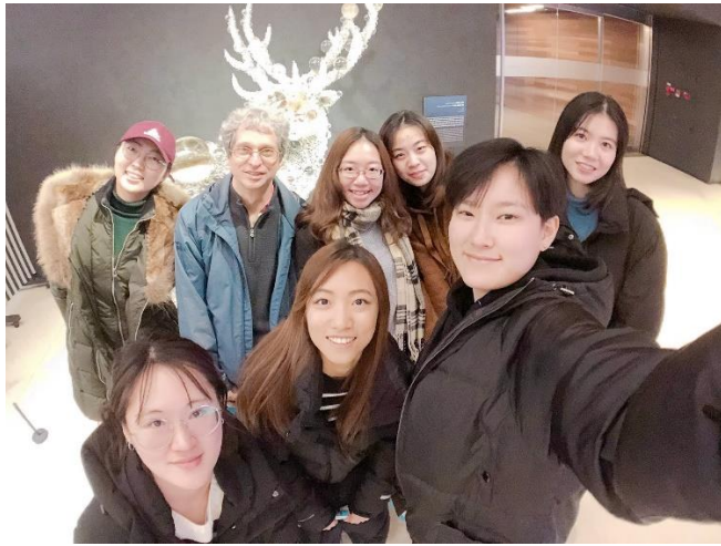
(去三星現代藝術博物館校外教學)