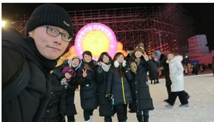
圖 6: 在哈爾濱跨年的我們