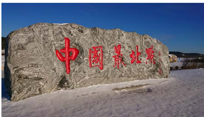
圖 7: 漠河，中國邊界前拍攝