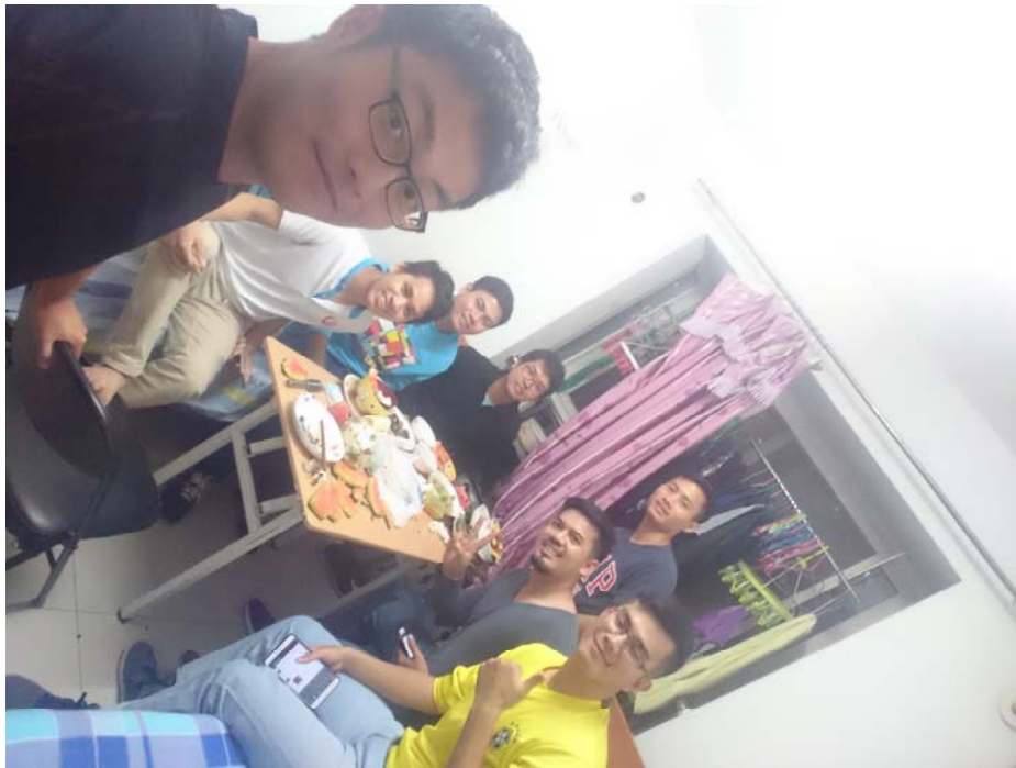
圖 3:與柬埔寨的朋友們共餐