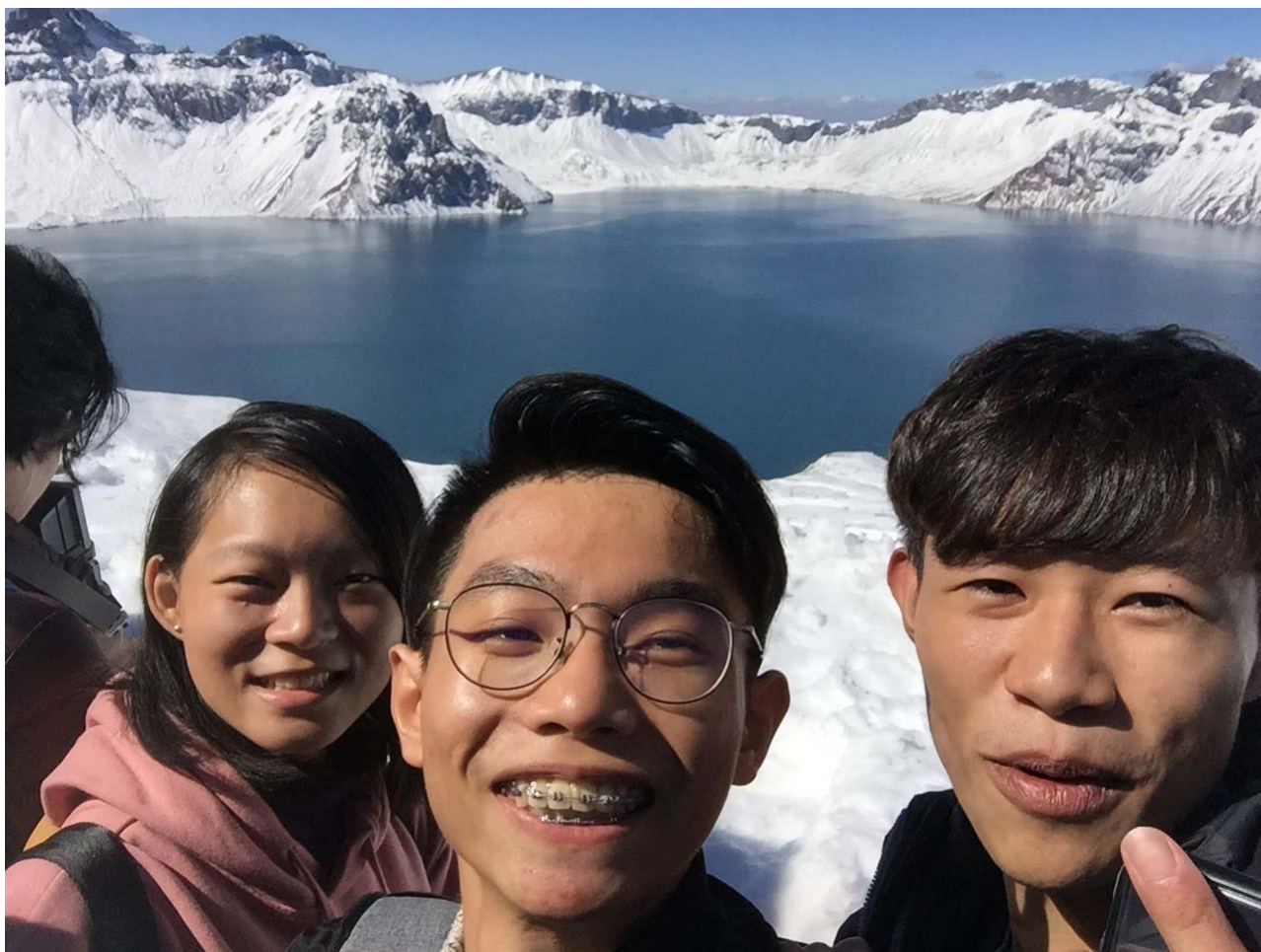
與長白山上的天池合照

* 請於返國一個月內將本報告「電子檔」寄交 gatsby.kinmen@gmail.com