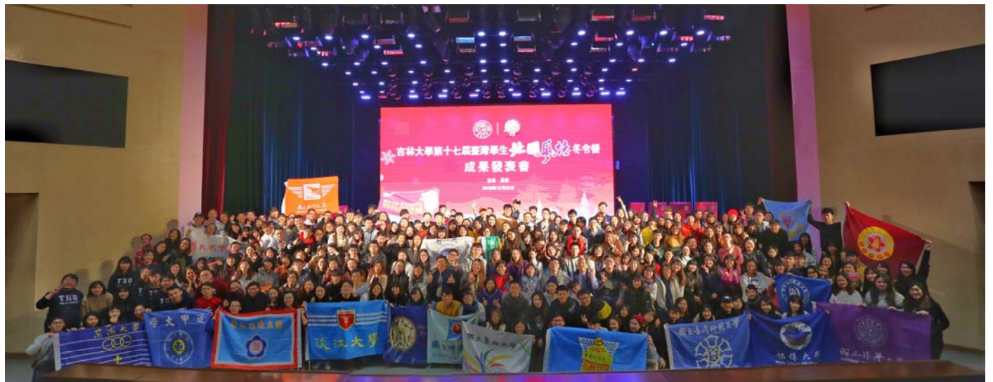
吉林大學北國風情冬令營大合照