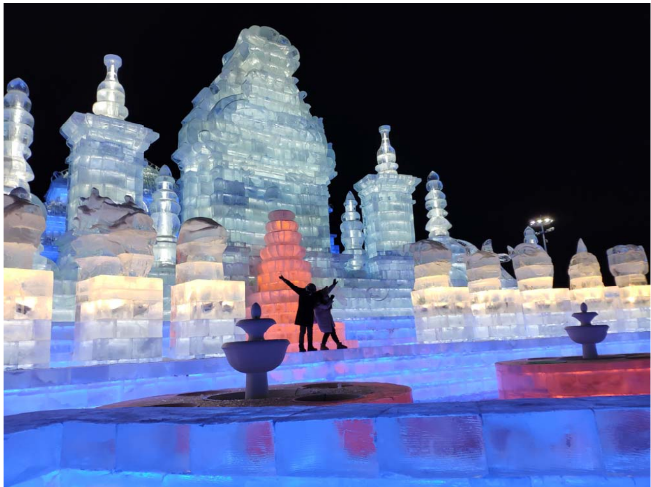
哈爾濱的冰雪大世界