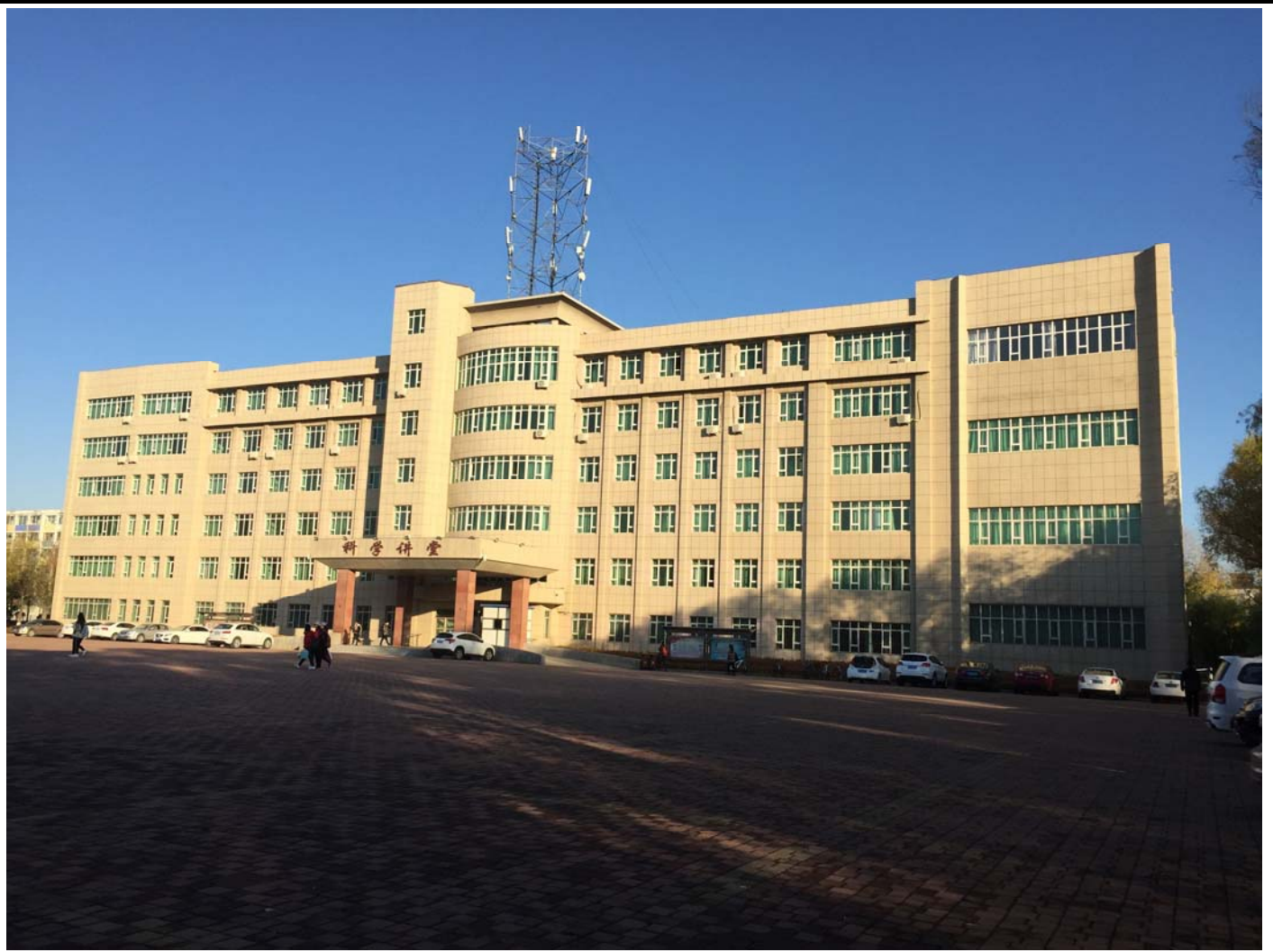
和平校區的科學講堂(我主要的上課地點)