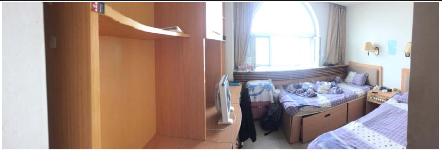
友誼會館宿舍內部