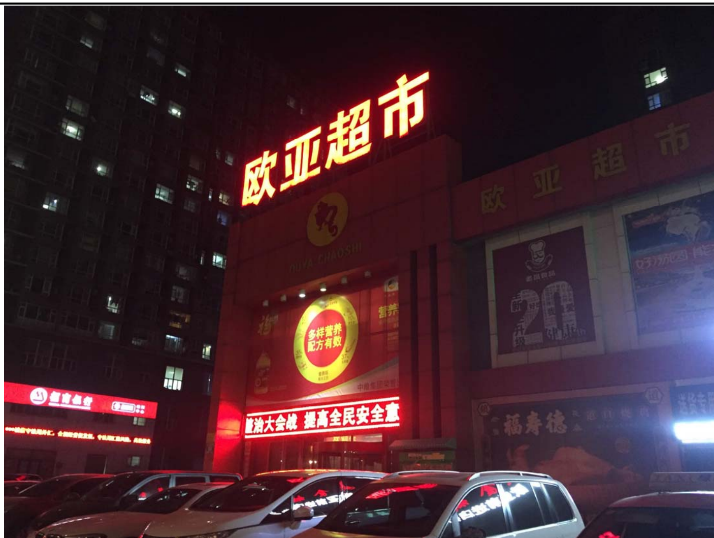
南湖校區附近的連鎖超市——歐亞超市