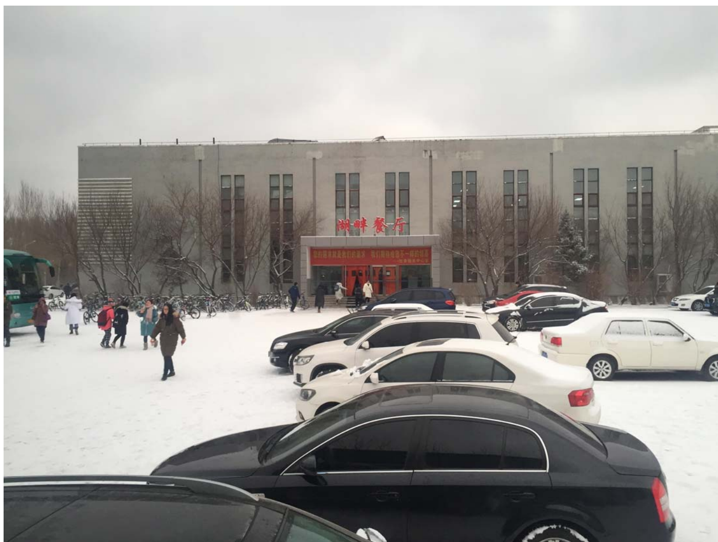
中心校區冬天景觀