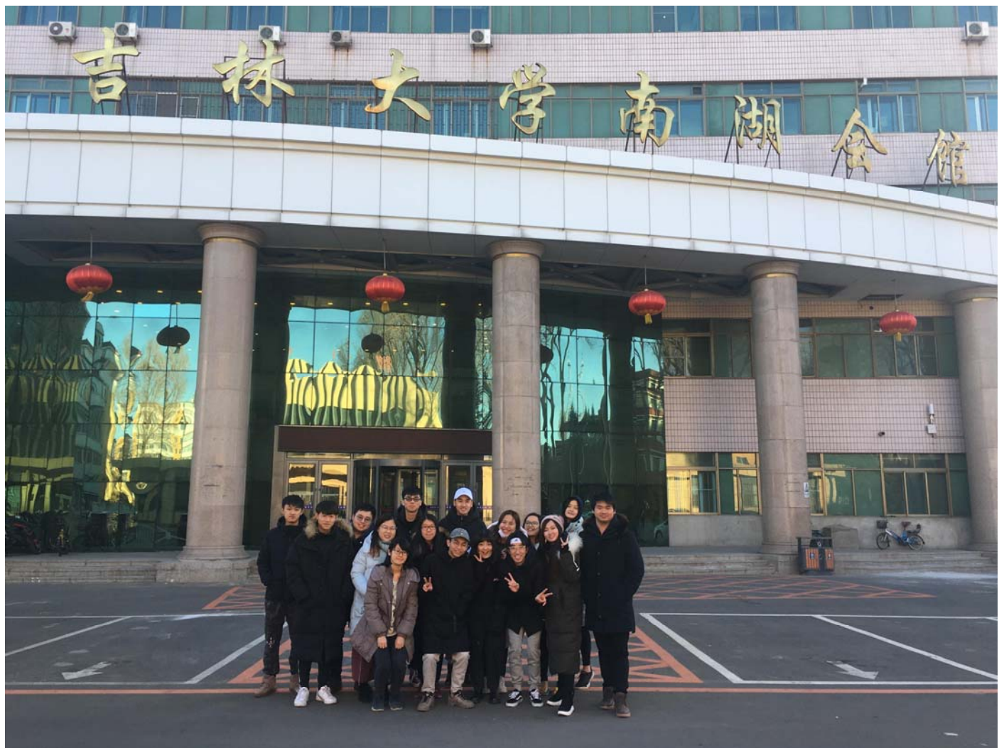
台灣交流生與南湖會館合照