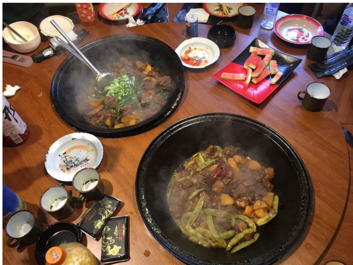
東北特色菜——鐵鍋燉