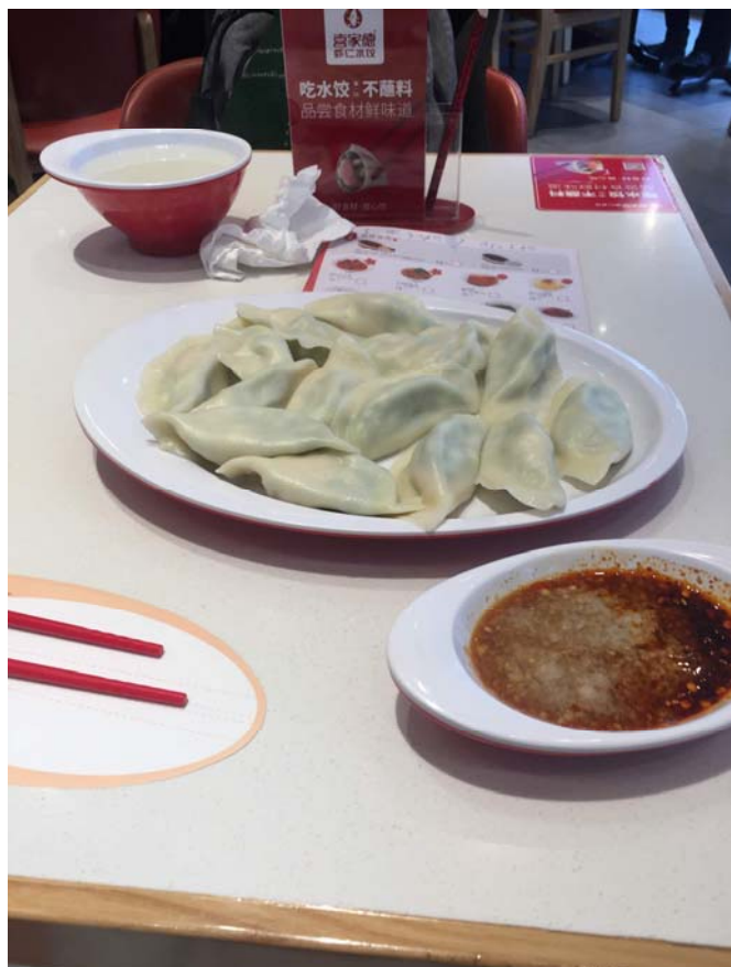
東北連鎖餃子店—喜家德水餃