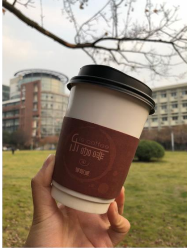
學校常常喝的咖啡

大概是華師一天裡最幸福的事了。華師的占地可能比起中國許多知名大學的範圍來說相對比較小，卻有許多我非常喜歡的小空間，光是能提供座位的飲料店便有五個，我每次需要做作業時都會去飲料店開始忙碌，除了需要花錢的飲料店之外，學校還有一些小小的自習空間可讓人發掘，很喜歡學校裡面就有這樣的小場所。