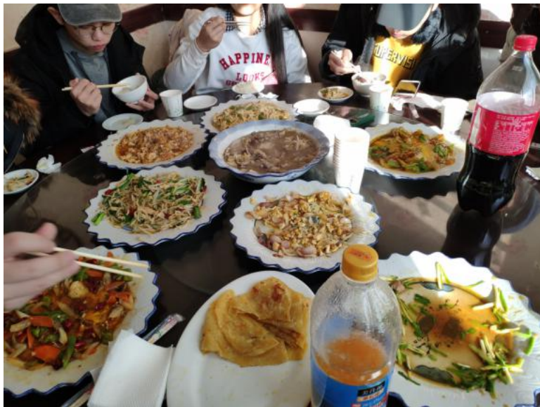
樸實的小村子餐館↓

這次的交流期間除了冬令營的哈爾濱，我還去了北京、長白山和內蒙古，體驗各種不同的風景和文化，還有各種少數民族，北京的漢滿族結合、吉林多是朝鮮族的朝鮮廳餐，哈爾濱則是有許多俄式風情和猶太風格的建築和文化，內蒙古的藏傳佛教建築很壯觀、馬奶酒很特別，草原卻有點枯黃，但依舊是台灣看不到的壯大草原，和清境農場綿延不絕的山頭不同，一望無際的平地是難忘的回憶，若能早點去想必可以看到更鮮艷的草地和花朵，另外，沙漠也是對於島國人來說最特殊的回憶之一。