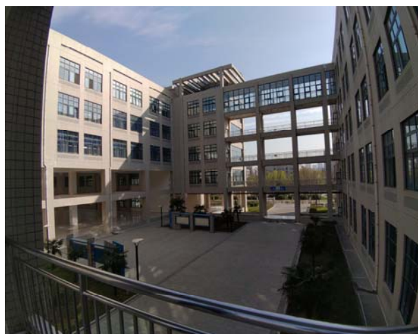
(長安大學渭水校區鴻遠教學樓實拍)