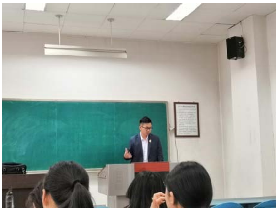
(網絡思想政治教育課堂報告 ing)

* 請於返國一個月內將本報告「電子檔」寄交 gatsby.kinmen@gmail.com