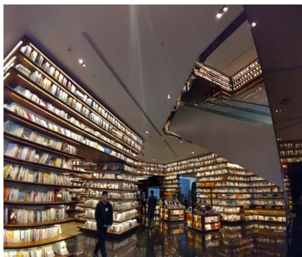
(西安網紅書店—「言几又」)