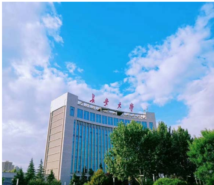
(長安大學渭水校區圖書館)