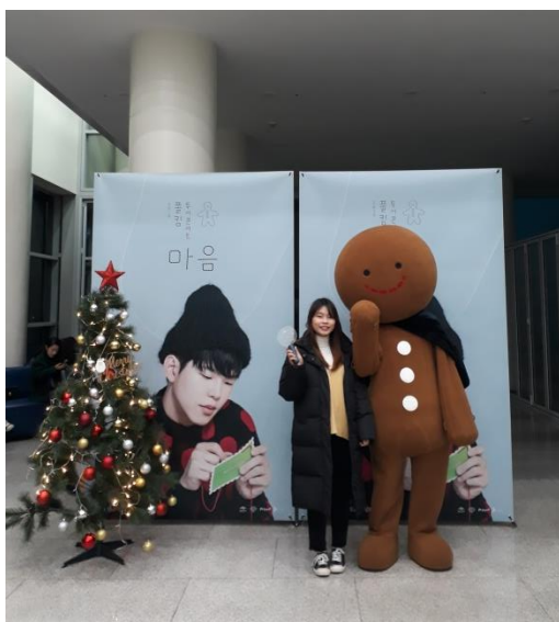
△平安夜去看演唱會