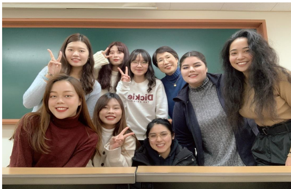
△最後一次上課與老師的合照

這堂是為外國人所開設的課，對於我來說是簡單的，適合只有基礎韓文的人選修，但此課有許多不同國家的人，加上課程時間安排方面，讓我選擇此課程，可以結交到歐美國家朋友及訓練英文口說，課堂也可以加強韓文口說及基礎文法。