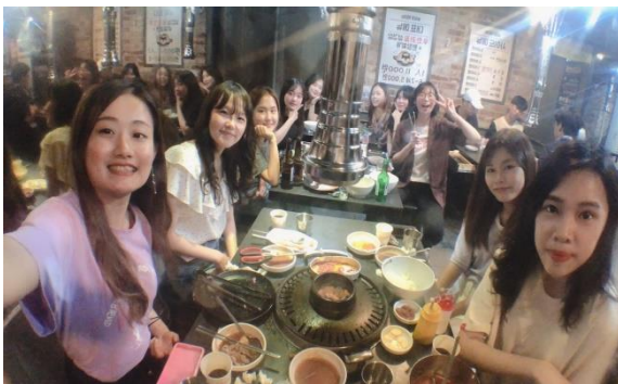
△與韓國學生一同吃烤肉

除了每天認真讀書外，偶爾也跟學伴及朋友一起吃飯或煮飯，假日也會利用時間跟朋友一起遊玩或者參加演場會或音樂祭，中間也有許多台灣的朋友及老師來見我，其中中秋節時，我去了大田市找韓國朋友敘舊，而課程結束後也跟不同國家的朋友一起去其他縣市，而我也為了自己安排了七天的獨旅讓自己從中學習獨立解決事情及生活，看看韓國其他地區的美景及品嚐道地美食，最後爸媽也來韓國找我，一起玩了八天的釜山首爾之旅還在當地跨年迎接 2020 新的一年，真的是很棒的韓國交換生活。