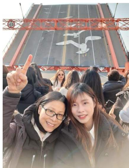
△回國前與家人釜山旅遊