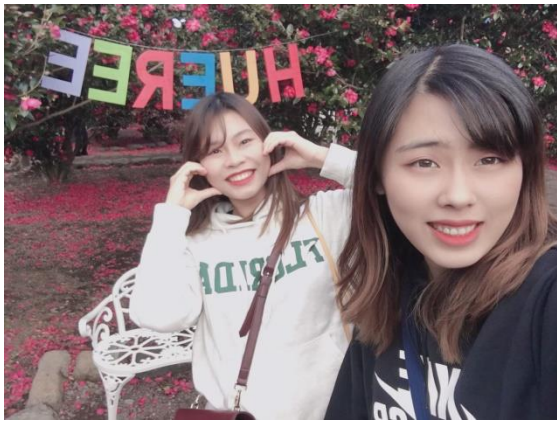
△和台灣朋友冬日遊濟州