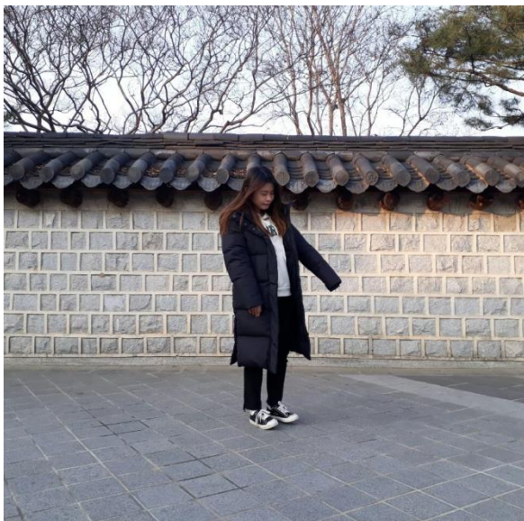
△獨旅七日遊中的全州市