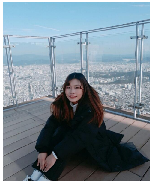
△獨旅七日遊中的大邱市