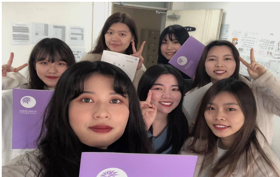
△與台日朋友於語學堂結業式合照

接受考試。而我最終是就讀三級，總共會有 3 位老師輪流教課且每周都有隨堂考(口說及寫作輪流)加上期中期末測驗，而課堂上老師也會要求與同學們利用當天所學來做會話，也會補充許多課本上沒有的單詞，而有遇上內容不解時老師也會給予幫助，讓我的寫作及口說提昇許多，最後學期平均 80 分以上及獲得全勤獎。