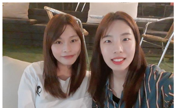
△與韓國朋友去咖啡廳