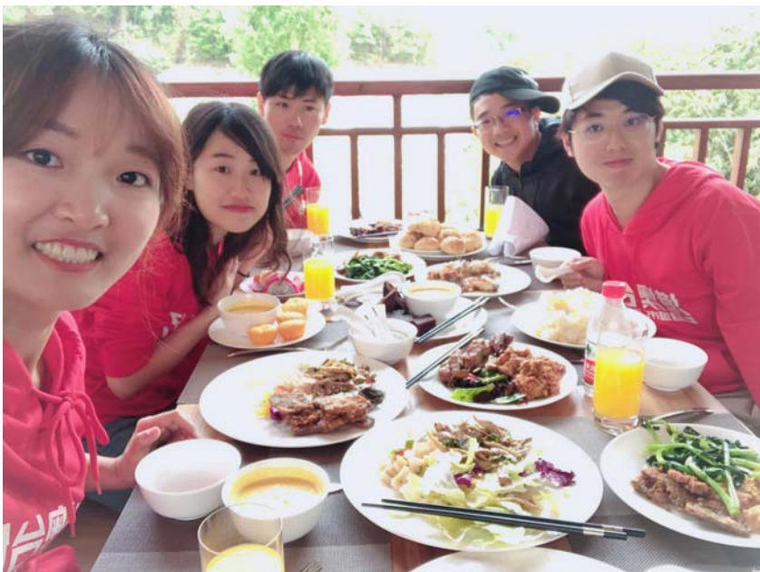
↑ 市政府活動結束後的午餐

四川位於中國西南邊，離最近的海岸都超過一千公里，可謂是內陸中的內陸；像這種地方，很多交換生基本上一輩子只會來一次，所以藉此機會把整個四川玩過一遍、周圍的重慶、雲南、貴州、青海、甘肅都不放過、更狂的是有人連西藏都飛了（一趟西藏遊最少要1萬5人民幣）。成都市政府與川大會對港澳台僑辦許許多多的活動（如：春遊），免費參加，可以玩好玩的地方（都江堰、青城山、海螺溝等），吃好料住四星級飯店。但是市政府的活動內容可能會涉及一點政治宣傳的意味、以後要從政的同學參加還請考慮一下。