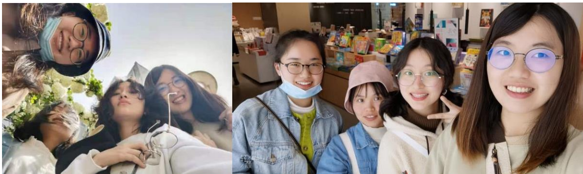
↑ 我的學伴&她的閨密們

在解除隔離前，我就已經和我的輔導員和學伴取得聯繫，跟另外兩個同樣來自台灣的交流生相比，我真的覺得自己非常幸運，他們基本上都是辦完手機和帳戶之後就被學伴放生了，但我幾乎整天都和我的學伴在一塊，我們一起上課、分組一起、吃飯也在一塊，也多虧他的電動車讓我從宿舍到教室省了不少時間，我的學伴帶我完完全全融入她的生活圈，完全沒有一點的不適應。