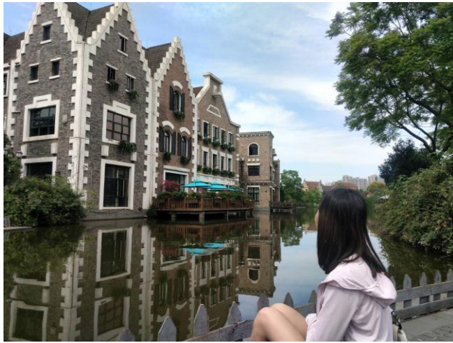
↑學習成都公園景觀設計