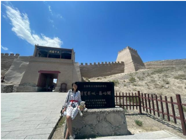
↑ 萬里長城起點嘉峪關