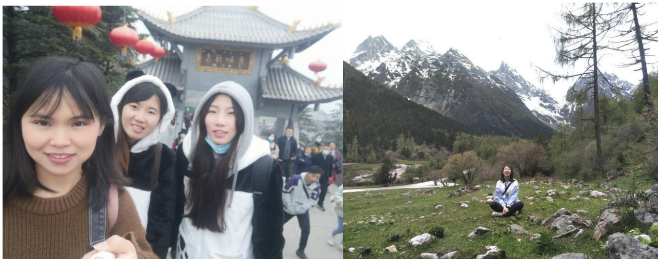
↑ 我的朋友帶我和室友去峨眉山

在熟悉川大的課程後我開始比較多自己的時間，就會在沒課時自己搭地鐵和高鐵在四川內旅遊。連假時若是我的小伙伴們都沒時間，我則是會去參加專做學生團的旅社，去一些要開車才到的了的地方，四處走走、四處看看，感受文化和風情，去走訪、去看那些過去只存在於課本或耳語間的地方。