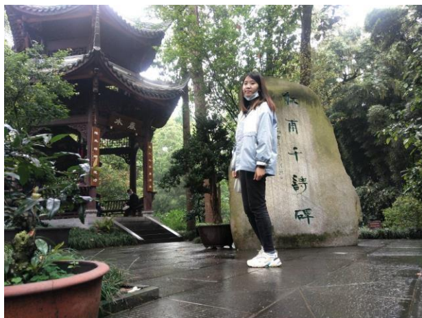
↑杜甫失意流落成都時的故居