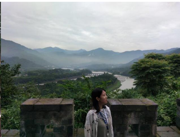
↑幾千年前的智慧結晶—都江堰