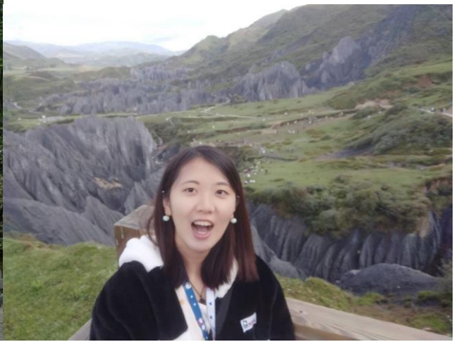
↑天然石林—墨石公園