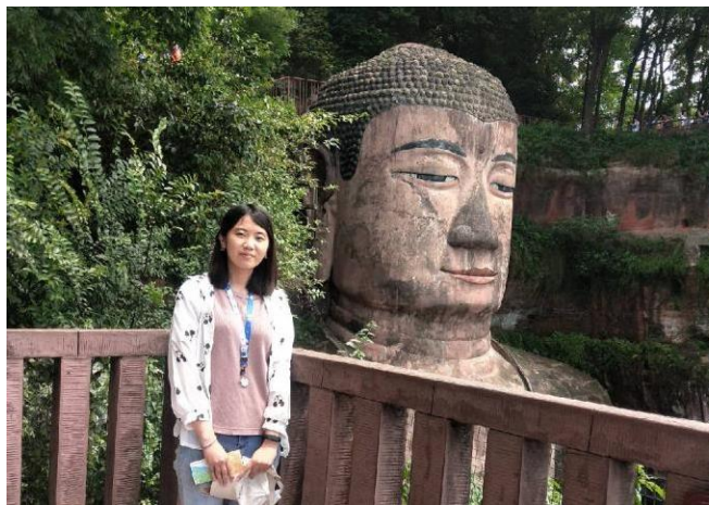
↑世界第一石雕大佛—樂山大佛