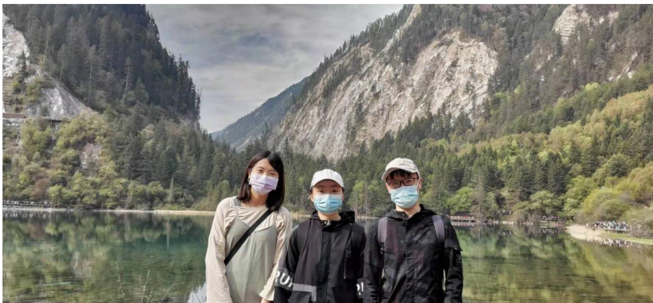
↑美的如詩如畫的九寨溝&在旅行團中認識的一樣是川大的好夥伴，結束旅行後我們每個星期晚上都會一起打籃球。