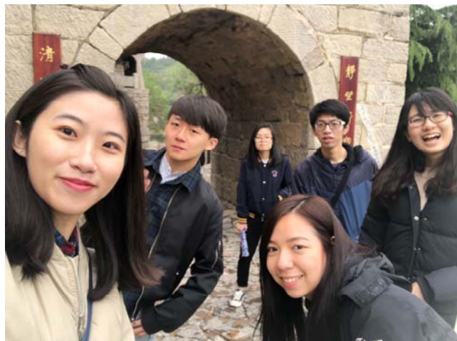
▲石家莊于家石頭村

海，美食很多，口味跟台灣接近，且物價較北京便宜，上海人也比較有禮貌、親切些。而住了半年的北京，使我大開眼界，我們都知道北京是個歷史古城，現今依然保有許多古建築，到現在還是有很多胡同裡的廁所沒有門，即使有門，還是有很多人沒有上廁所鎖門的習慣，使我震驚，這是在台灣絕對看不到的景象。非常慶幸能夠利用交換的機會到中國看看，體驗到跟台灣截然不同的生活，並交到許多朋友！