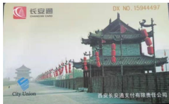
▲西安交通卡(長安通)