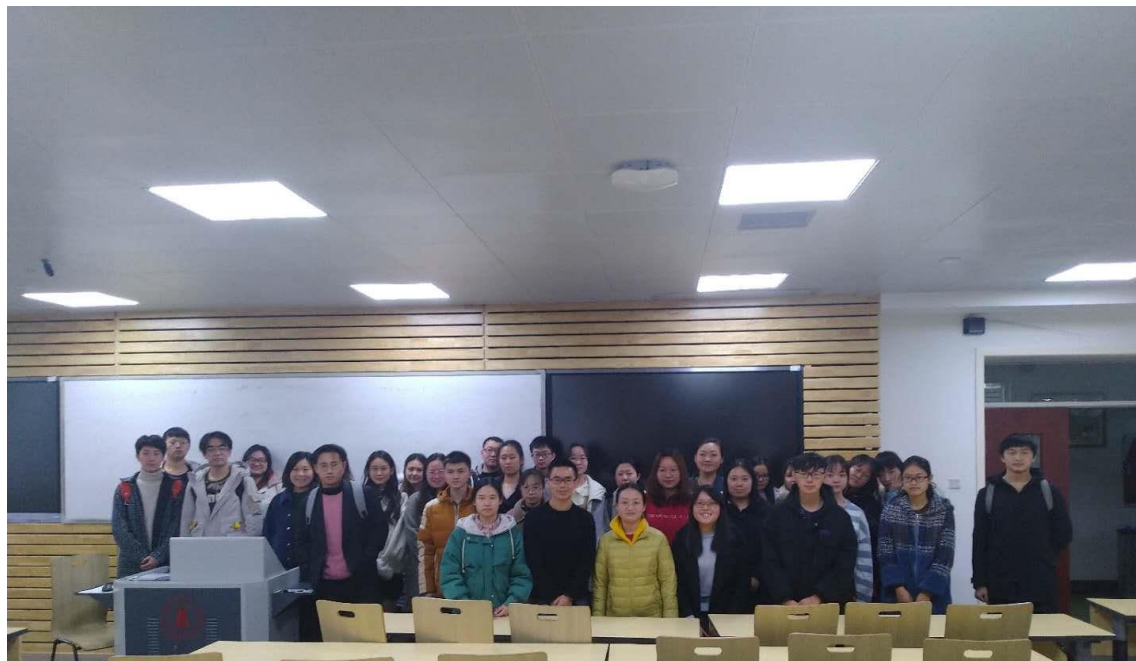
▲ 2017 級食品科學與工程學系同學

我交換的科系與我在金門的科系相符，所以我幾乎都選修系上的專業課程，有 5 門系上的課程（包括兩門實驗課）和一門外系的生物統計學，一共選修了 14 學分。一般在教室上課與在金門上課大同小異，系上的實驗課就比較有趣。我在川大所修的兩門實驗課分別是食品分析實驗（2-9 周）與食品微生物實驗（11-17 周），兩個實驗課一個學期錯開來上，大陸實驗課使用較接近手動的實驗儀器，需要長時間的練習來把握精準度。