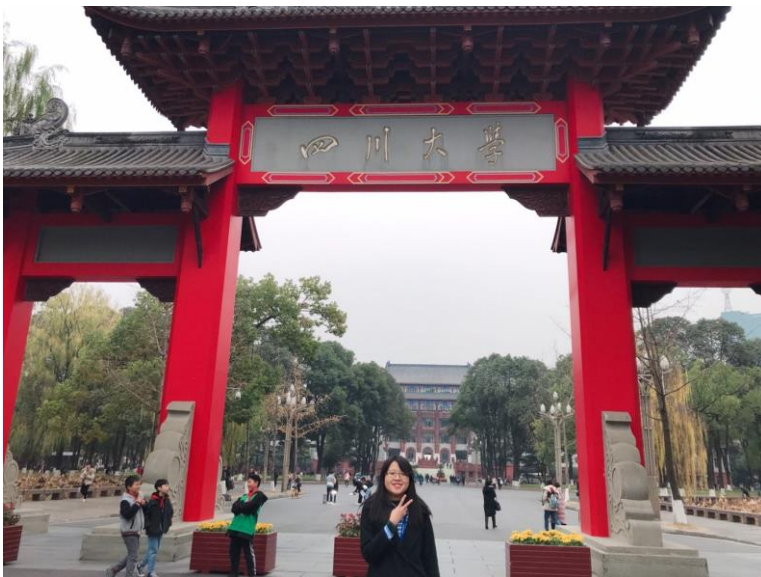
▲ 四川大學望江校區北門

四川大學，簡稱川大，位於四川省成都市，起始於 1896 年是大陸歷史最為悠久的大學之一。現為大陸著名的「211 工程」、「985 工程」、世界雙一流大學建設高校 A 類的全國重點大學。四川大學是由四川大學、成都科技大學、華西醫科大學三所全國大學經兩次合併而成。截至 2019 年 1 月，一共三個校區有望江（大三、大四、研究生校區）、江安（大一、大二校區）與華西（醫學院校區）校區。