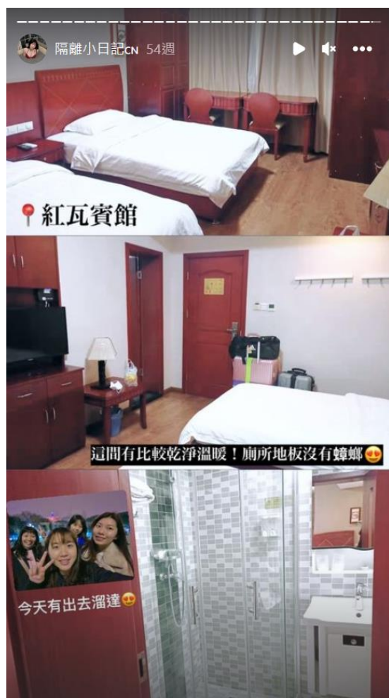
◀ 第三個隔離地點，14+7+7 的最後一個+7，可以外出 一樣是川大提供的免費隔離點唷