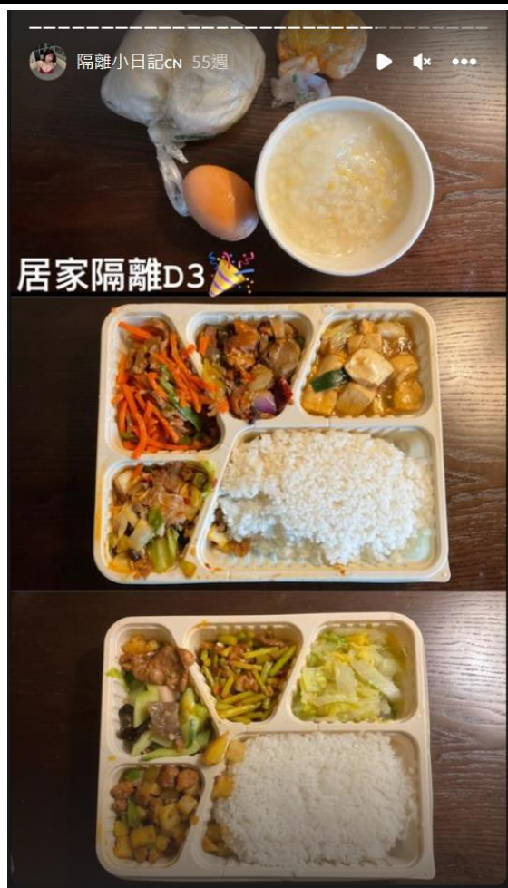
◀ 北苑賓館隔離的每日三餐大概都是長這樣嘿