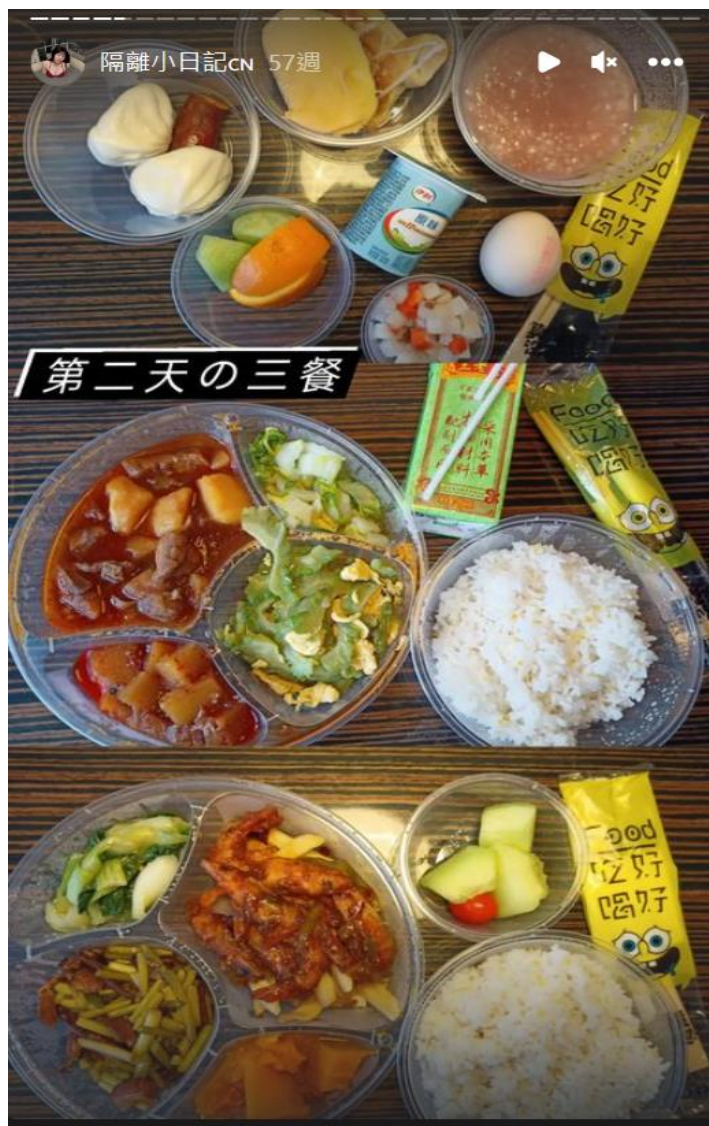
▲隔離酒店的三餐大概是這樣的，超級豐盛哈哈，元宵節當天甚至還有湯圓