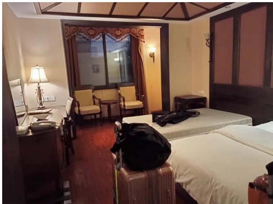
▲第二個隔離地點，四川大學提供的北苑賓館，免費隔離7天