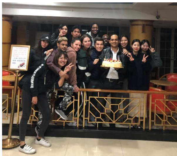
● 幫拿著蛋糕的埃及朋友慶生

之後我就融入了他們，他們會找我去慶生吃蛋糕，在節日找我一起狂歡，萬聖節扮鬼，耶誕節同歡，都讓我不孤單，甚至找我一起參加一個線上電商知識大賽，讓我的生活還多加了點壓力，要一起學習要一起考試，我還很榮幸在初級考試拿到上師大學生裡的最高分！我還能跟他們交流學習西班牙語，簡直划算的真人家教呢！即便他們都在徐匯校區，卻從來沒忘了在奉賢的我，真的很感動。