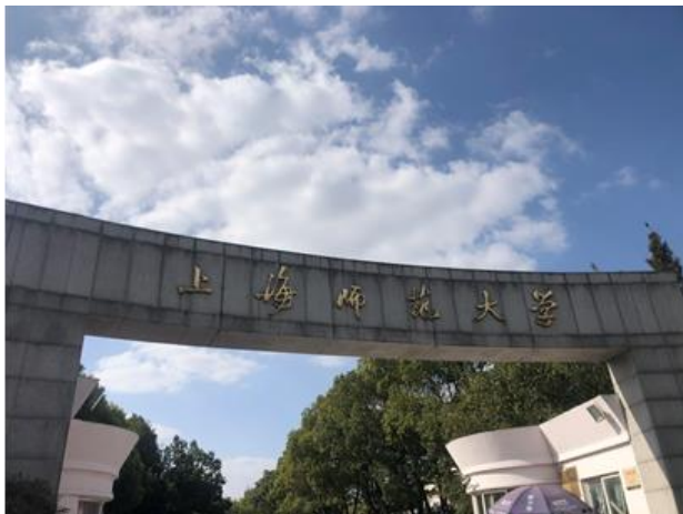
● 上師大奉賢校區東大門