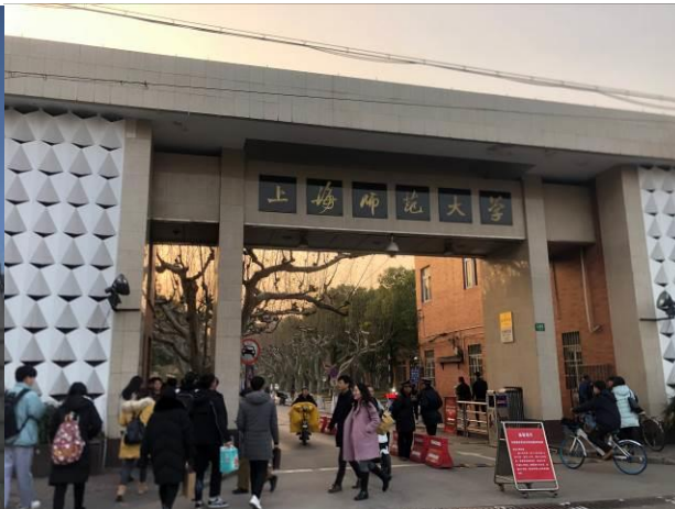
上師大徐匯校區西部東南門