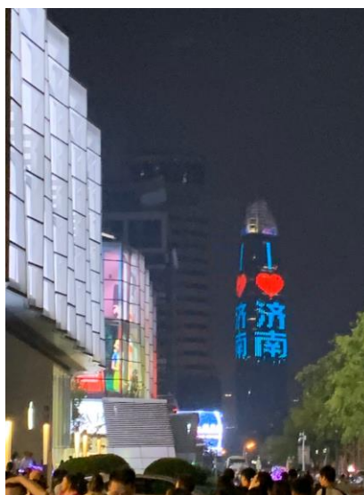
在大陸認識的朋友