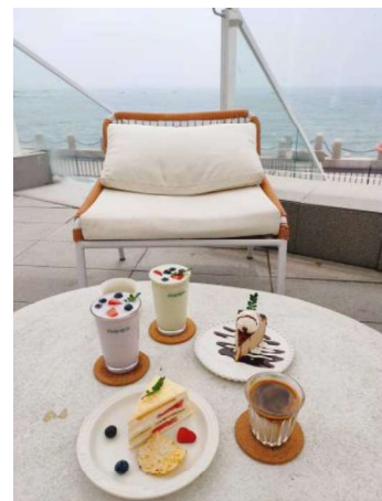
青島 太平角公園附近咖啡廳