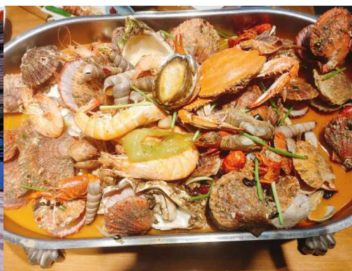
學校附近餐廳 海鮮大咖