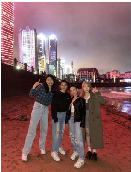
青島 第三海水浴場