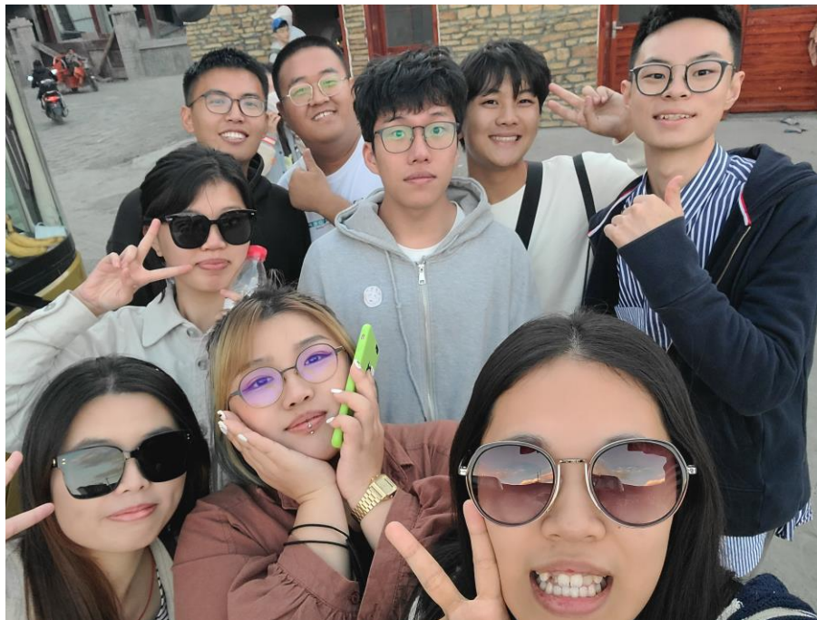
圖三：川西旅遊(第二排左一)

我想鼓勵所有在考慮到大陸或者是國外交換學習的同學能夠勇敢申請。到四川大學交換學習是我現在回覺得特別慶幸的一件事，我在這段期間所收穫的不僅僅是上述的這些，還有像是友情、成長以及看到的美景等等很多無法用言語描述的，也是一生難以忘記的。