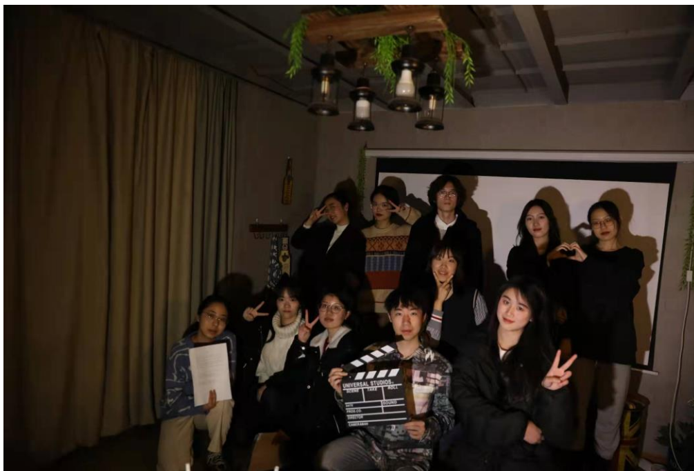
圖二:拍攝微電影《透視》(下左三)