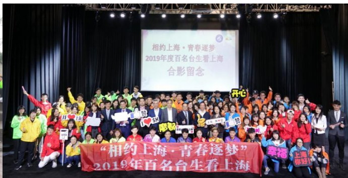
▲百名台生看上海(好像每年都會辦，有興趣可以取去看看)