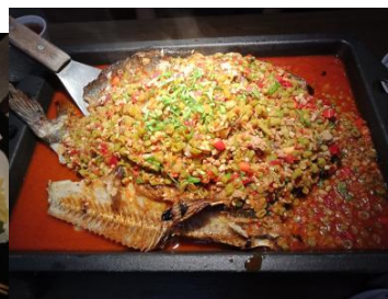
▲這只是微辣的烤魚