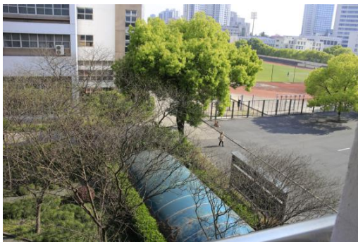
▲宿舍外面的風景(一出宿舍門口就是體育館、操場、驛站)

我們跟大陸的學生住同一棟宿舍，所以理所當然我們洗澡也是跟他們一樣是公共澡堂，不過女生宿舍旁邊就是驛站(取貨的地方)。因為我是在市區的校區，所以學校側門出去不用 5 分鐘就能到地鐵站、公交站，而且搭地鐵到火車站超級方便；不過郊區的學校離地鐵站有段距離，學校很多的腳踏車可以騎，不過那邊是大學城，通常什麼商店都有，所以也不用太擔心。