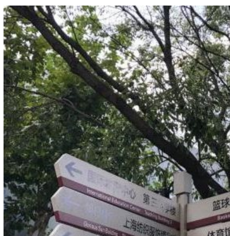
▲路上都會有指標，不用怕迷路