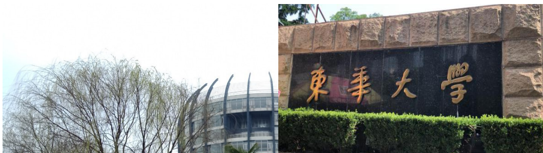
▲松江校區圖書館(也是學生證上的圖案) ▲延安校區側門的標誌

上海東華大學是是一所位於中國上海市的公立大學。是教育部直屬、國家「211 工程」重點建設的高等院校。前身為創建於 1951 年的華東紡織工學院，1985 年改制為中國紡織大學，1999 年更為現名。 共有兩個校區松江校區(郊區)、延安校區(市區)，只有管理學院跟服裝設計專業在延安校區，其他都在松江。