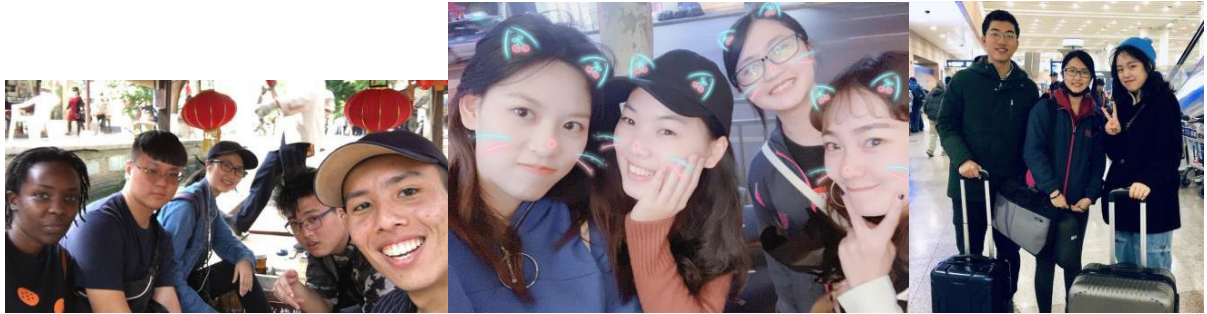
▲其他學校的交換生與非洲的國際生

(五) 有任何問題都可以多多詢問學伴，自己解決不了的事情也可以尋求老師的幫助，交換期間室友、老師、學伴、交換生是很重要的角色。