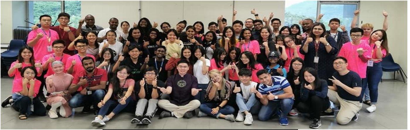
利用假日時間，參加學校講座---MINDFULNESS 正念