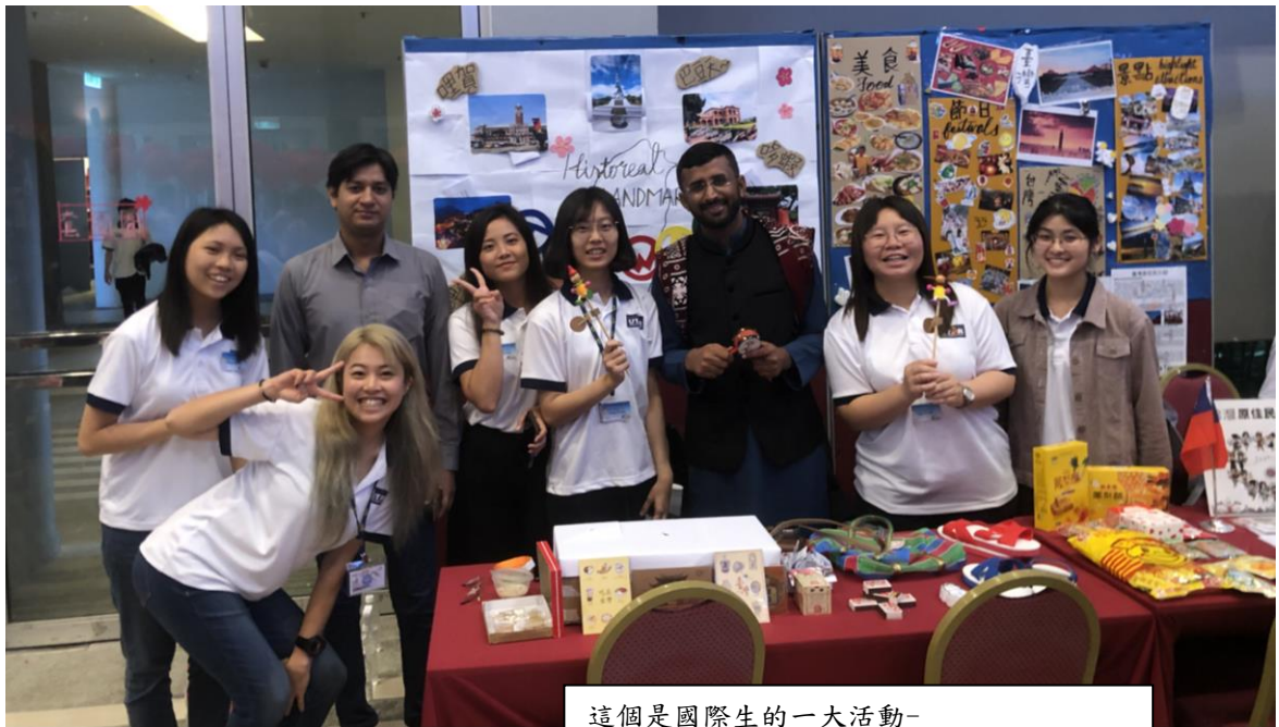
這個是國際生的一大活動- UTAR INTERNATIONAL DAY 國際日 台灣站