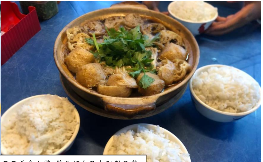
馬來西亞美食大賞 等你們自己去配對品嚐