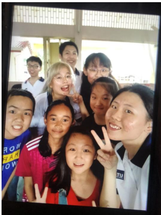
這是學校 USSDC 的活動 假日社區服務 到附近新村的教學活動 早上 6:30 起床做公益有益身心健康 😊