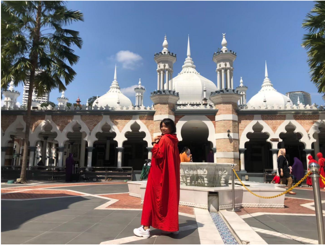
鼎鼎大名的占美回清真寺