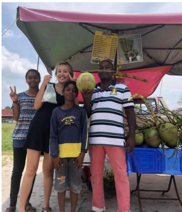
馬來西亞隊愛喝椰子的我 根本是天堂 喝到變麻吉的 路邊椰子叔叔~便宜又解暑