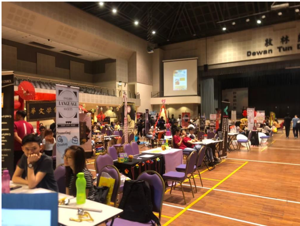
社團博覽會，各種各樣社團都是交朋友的好所在