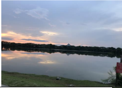
首先是很美很美的校園-網美打卡點 我就是騎腳車騎這個湖騎到懷疑人生