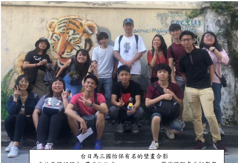
台日馬三國怡保有名的壁畫合影 我的馬國好朋友 帶我趴趴走 學伴國際處老師聚餐