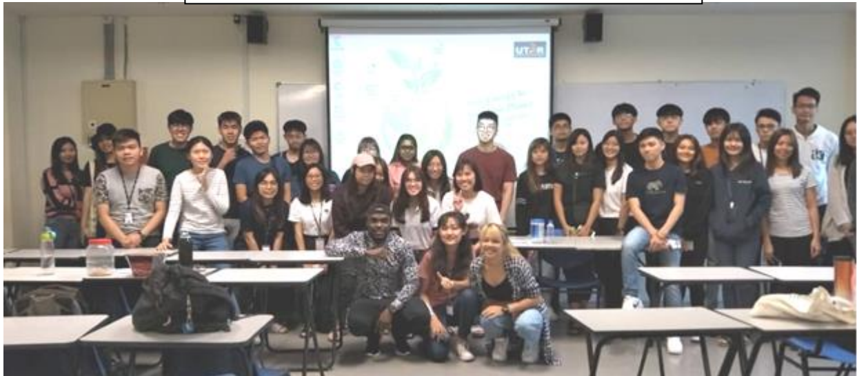
感謝 USSDC 的邀請，讓我能當講師介紹金門台灣給大家認識