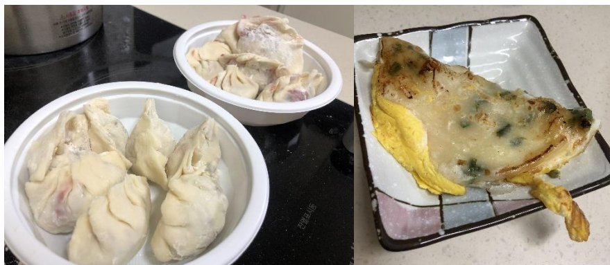
▲自己包水餃、做蛋餅

因為在韓國飲食文化的不同，有些食物無法吃的到，利用可以買的到的食材做台灣的食物，也教了丹麥同學怎麼做台灣蛋餅。