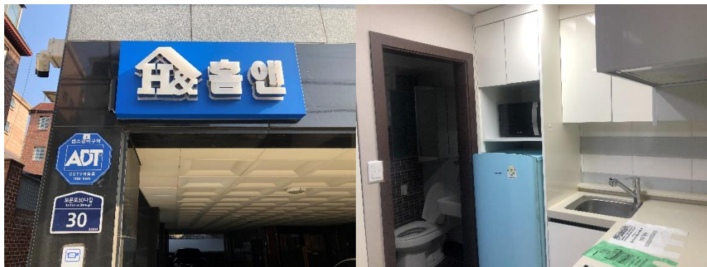
▲ 宿舍外觀及房間內廚房