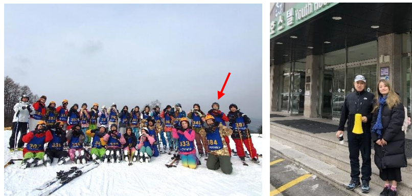
▲和滑雪課同學及教授合照

Welli Hilli Park 有市區跟度假村的接駁公車，非常方便、價錢單趟 10,000 韓幣(約台幣 270 元)，首爾大約 12 月初開始有機會降雪，滑雪場也會有人工造雪，到了韓國有機會可以體驗看看滑雪的樂趣。