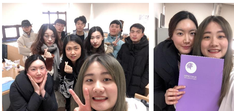
▲和一級班同學及老師合照

語學堂的授課時間為星期一到星期五的早上九點至下午一點，每天四小時的韓文課，因為口語練習不夠，所以被分至一級班，平時共有三位教師輪流授課，授課用書為首爾大的一級的教材，加上誠信女大自編的練習冊，上課除了教科書的聽、說、讀、寫，還會有隨堂作文練習、口說及寫作測驗，以及期中、期末測驗。測驗內容主要都在課本及練習本中，只要認真上課、復習內容，都能得到不錯的成績，如果在上課前先預習內容，會更容易能理解老師上課的內容，也能增加與老師練習的機會。