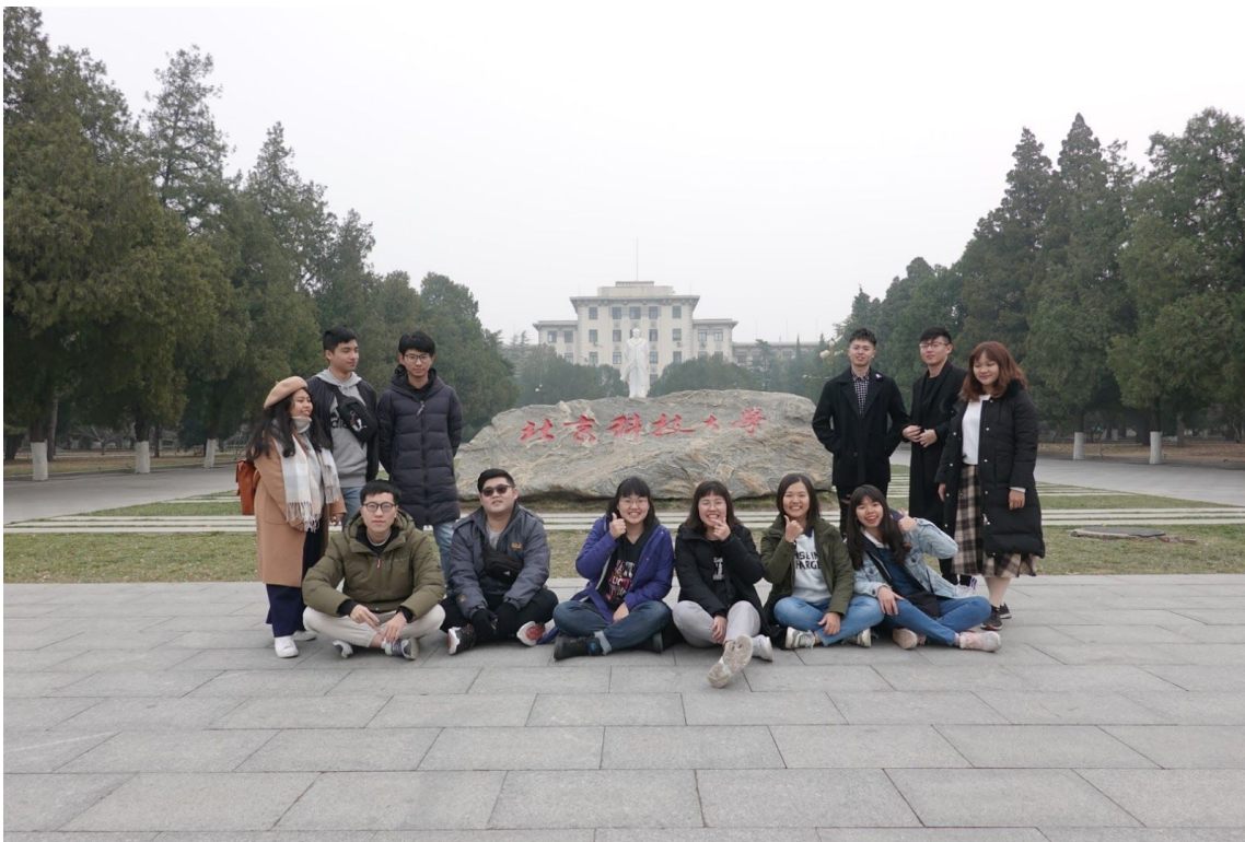
▲在北科大的同伴們

由於地處金門的位置優勢,我在大學期間參加了許多和大陸的合作活動,讓我對大陸有更大的瞭解與興趣,從原本參與之前認為應該和台灣沒什麼差別,到參與之後對於大陸的人文社會和自然環境皆大感驚奇,希望能和更多人推廣,讓大家都瞭解到大陸的不同,以便促進更多合作往來,尤其是去年(2018)暑假期間有幸被選中參加與中國政法大學和金門大學的夏季交流活動—一脈炎黃,尋夢法大,活動的前幾天在北京,我除了參觀北京許多以往只能在課本或電視網絡上所看到的紫禁城、天安門和鳥巢等名勝古蹟景點,讓我大感驚艷;也和法大的師生做了許多學術與思想的交流,我對於他們의思想和學習態度感到深深的敬佩;還參觀北京海淀區人民法院觀審,感受到了大陸法律的嚴謹,想更進一步的去瞭解認識;更在那裡上了“兩岸法律文化比較”、“當代中國社會”、“中國法律文化傳承與變革”等三堂課程,感受到了不一樣的教授授課方式與課堂氛圍。活動的後面幾天是到山西運城參觀,在那裡我們參觀了幾所小學,看到了大陸從小就開始培養小孩的信心,讓他們有信心面對未來巨大的挑戰;也參訪當地的特色小區,瞭解了他們對於規畫設計在各種細節方面的努力和用心;還參觀了歷史悠久的關帝廟和鸛雀樓,感受到了中國曆史的博大精深;更拜訪了當地的養老機構,認識了中國傳統德孝文化。由於這次的參訪,我更加地體會到中國的地廣物博及科技之日新月異,讓我對於到大陸交換有了極大的興趣,也認為這短短一週無法滿足我對於大陸之好奇心和崇拜,因此想要藉由交換的機會用更長的時間來看看這個廣大的大陸,去到更多不同地方認識更多厲害的人,替自己放大眼界增廣見聞,學習更精深的知識,成就更好的自己。