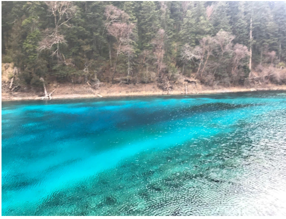
▲ 九寨溝奇特的水顏色