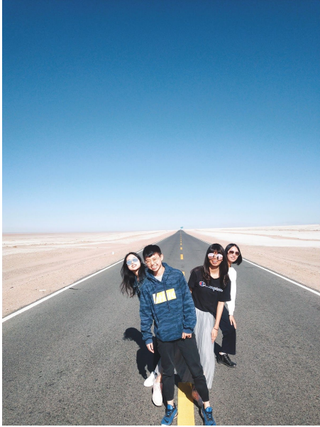
▲西北大環線的無人公路