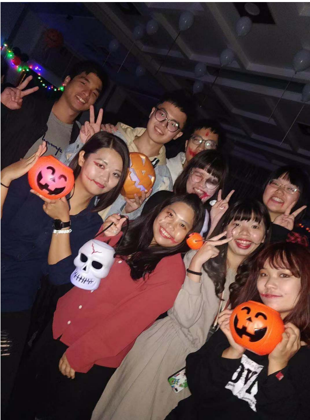
▲參外國人辦的萬聖節活動