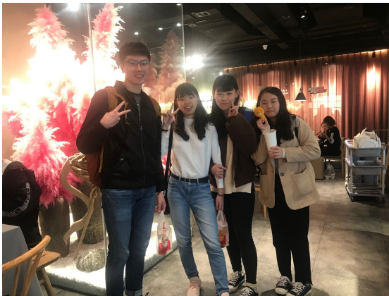
▲成都除了有名的麻辣鍋，小吃也非常優