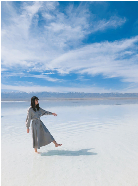
▲西北大環線的天空之境