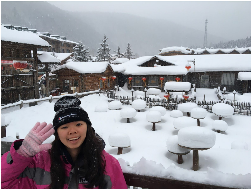
▲ 哈爾濱像童話的雪鄉