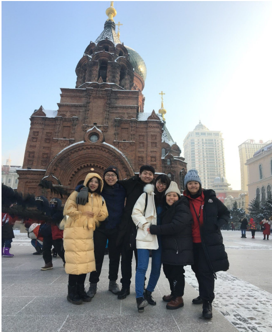
▲哈爾濱跟團認識的哥哥姊姊們