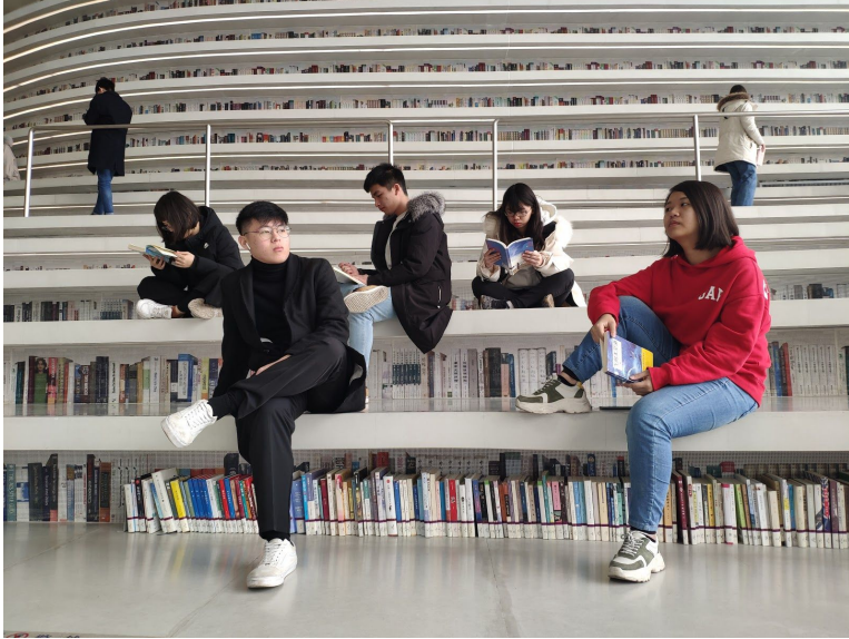
▲ 天津裝潢奇特的濱海圖書館