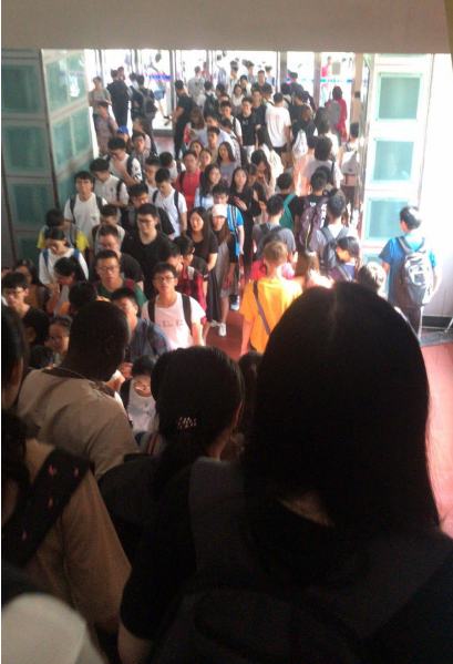
▲上課時間湧入教學區的人潮