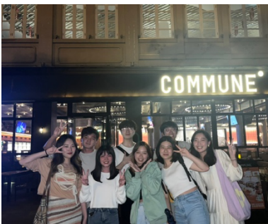
金大的朋友來廈大交流