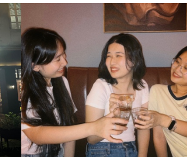
與班上同學的聚會