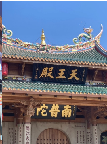
南普陀寺（廈大旁邊）