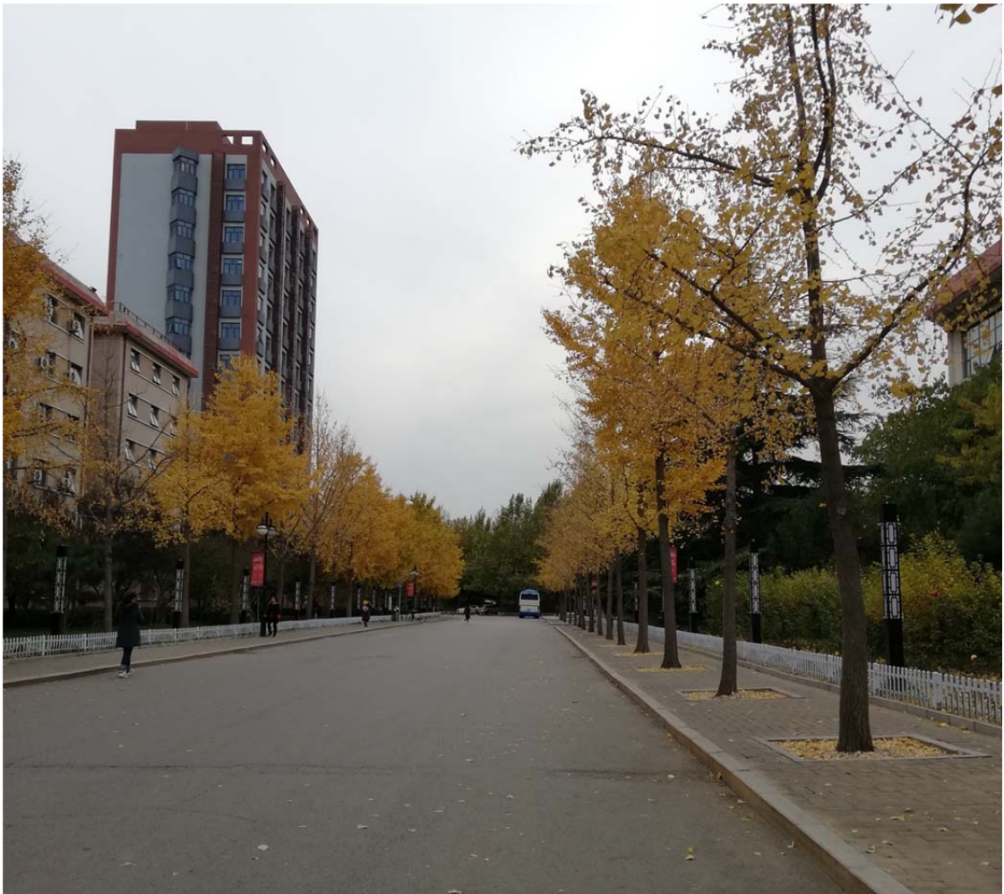
(學校主幹道，銀杏樹)