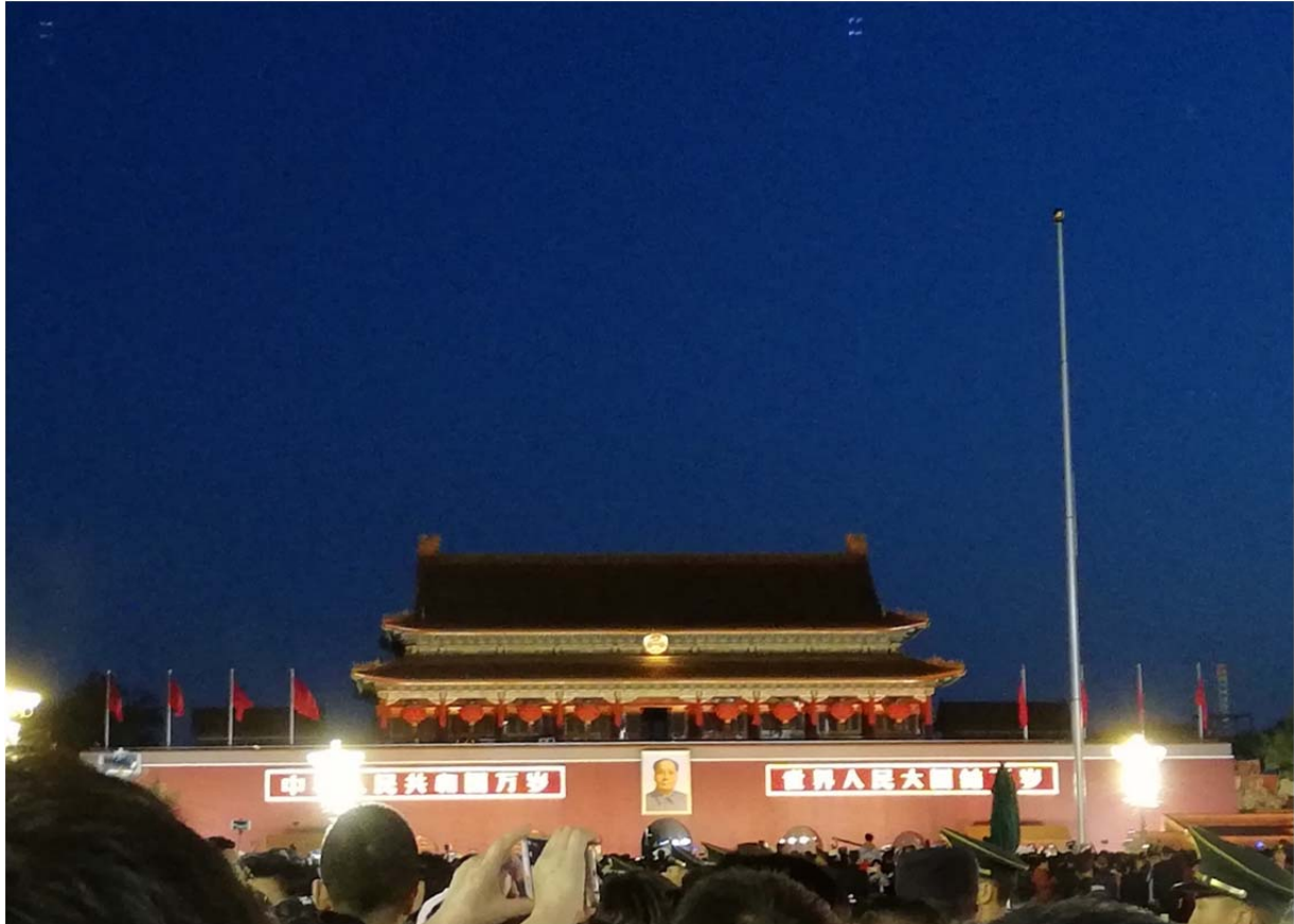
(天安門，國慶日去天安門看升國旗)