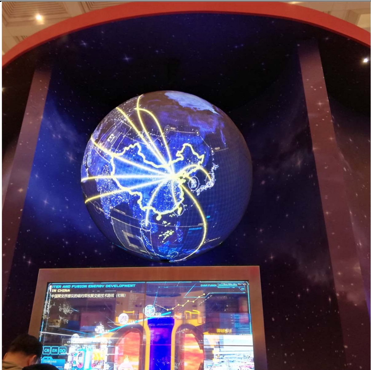
(国家博物馆，改革开放 40 周年特展)

很感謝金大給了我這次交換的機會，讓我體驗了不一樣的學習環境和生活習慣。感恩那些在我交換期間幫助我的老師和同學，謝謝你們，感恩金大，感恩法大！