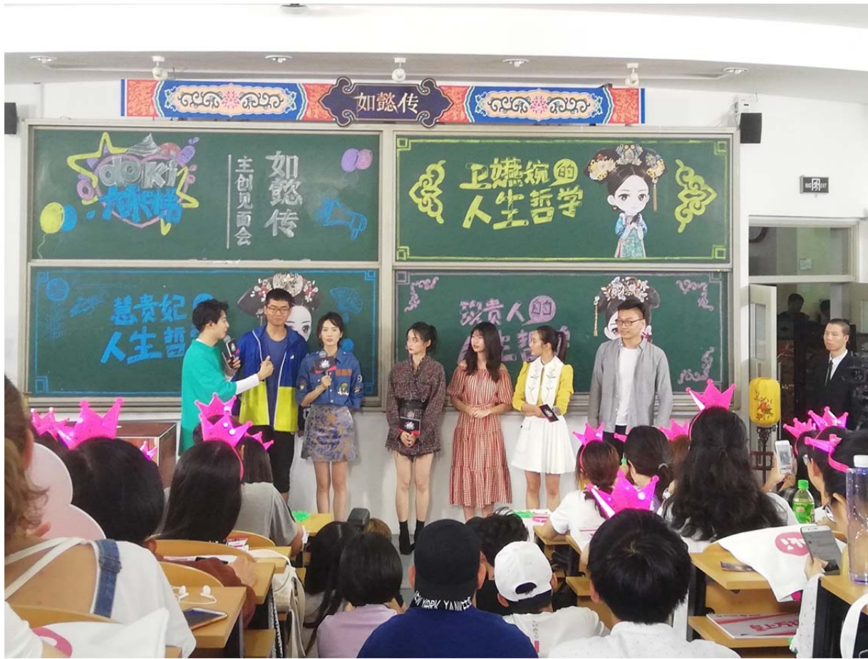
(如懿傳來學校宣傳)