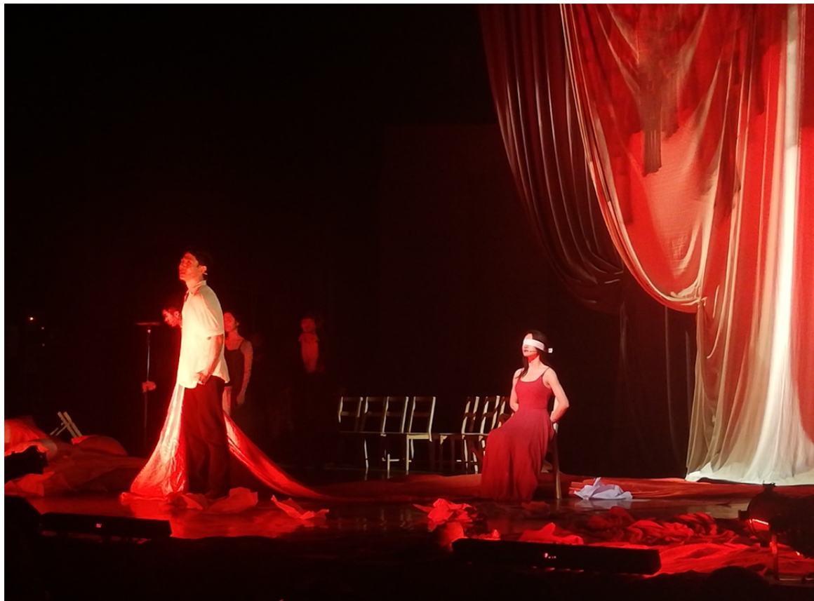
(《戀愛的犀牛》，舞台劇走入校園活動)