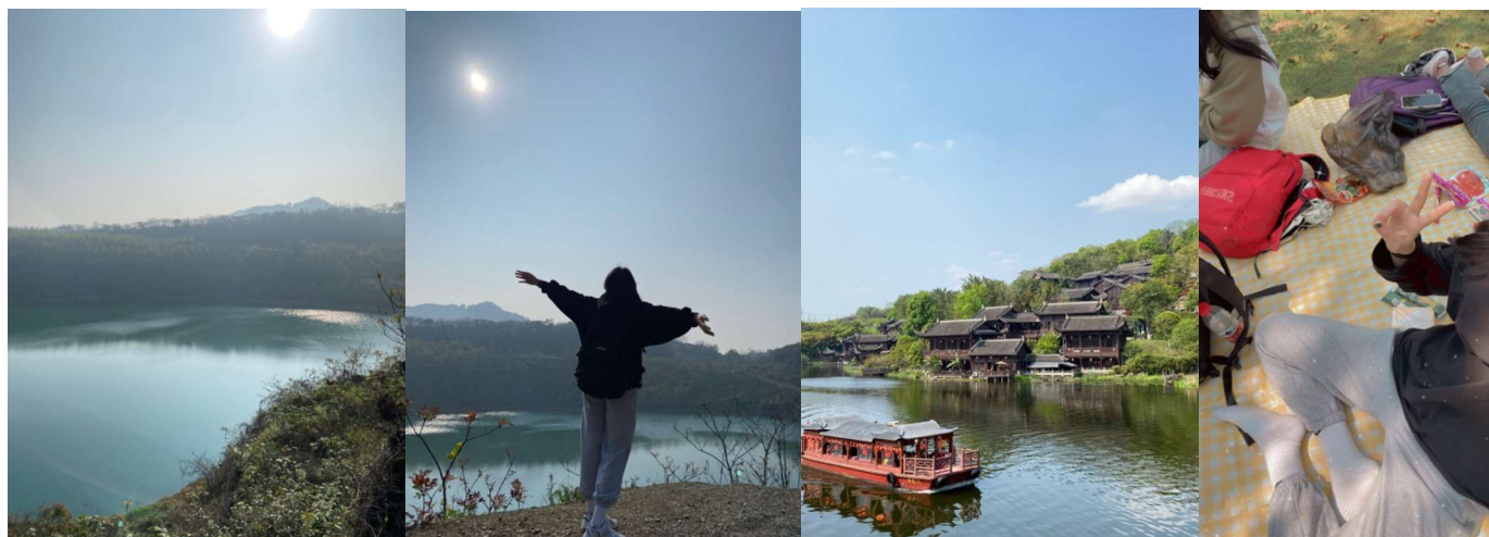
(早上 5:30 跟室友去爬山、下午到園博園野餐)