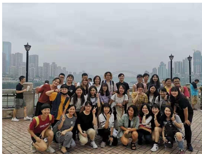
圖9：台灣交換生合照

2) 秋季武隆訪學之旅：2019.10.18~10.20在這三天兩夜中，重大港澳台學生和交換生一起暢玩重慶武隆，這次旅程走訪了武隆知名景點：天生三橋（變形金剛4拍攝地）、仙女山及芙蓉洞，另外還觀看了一齣精采萬分的戲劇——印象武隆，三天兩夜的旅程雖然短暫，但是與眾多來自相同地域的同學們遊玩，一起欣賞武隆之美及當地風情，途中歡笑及快樂的聊天聲充滿遊覽車及各個景點，讓我這三天過得很快樂！除此之外，我也從中學習到武隆的石灰岩地形的形成原因以及感受到當地傳統文化延續，這趟旅程精彩重實，並且有意義！！在這次訪學之旅結束後，各組依照旅行前所分配好的主題各自去探討，我們這組的主題是——武隆少數民族的研討，主題內容有武隆地區少數民族的分佈、土家族簡介、苗族簡介及仡佬族簡介，從這個主題的探討讓我更深入了解到武隆地區多元的少數民族文化，擴展我的新視野，改變我對重慶及西南地區的印象，除了我這組的主題之外，我也從其他組所探討的主題中學習到武隆的地形、地貌、觀光發展及美食等事物，我這時才明白武隆這地方看似是不起眼的小城，但是卻蘊含了許多自然及文化的寶藏，有世界文化遺產的地形景觀——喀斯喀地形，也有豐富多元的少數民族文化聚集在一起，一同呈現出多元樣貌的武隆地區。這次的秋季武隆訪學之旅玩得很開心，也學習得很充實，豐富了我這趟重慶交換學習。