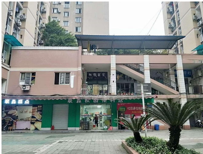
圖6：A區校園內的超市