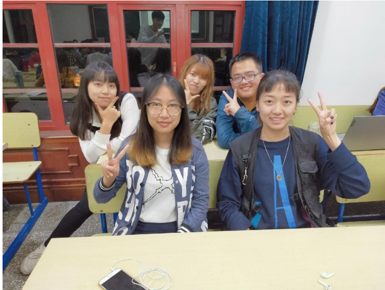
圖3：《創新管理》小組成員，每週討論報告須交一份討論紀錄、錄音檔及小組照。

透過這學期的交換學習，我學習到很多知識，也看見了很多台灣以外寬廣世界的事物，我認清自己在學業知識上其實要加把勁，學習要更加有方法和有系統性，也認清自己視野真的很狹小，看得不夠遠且廣，我回去台灣之後應該要加把勁在學業知識上的研讀，用對方法和有系統性的方式吸收，除此之外，我希望自己將來必定要走出台灣，走向世界去看見更寬廣的世界，讓自己能改變和成長，才有能力去翻轉台灣的未來。