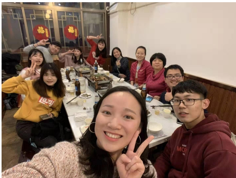
圖20：2019秋季台灣交換生的期末分享會暨餐聚