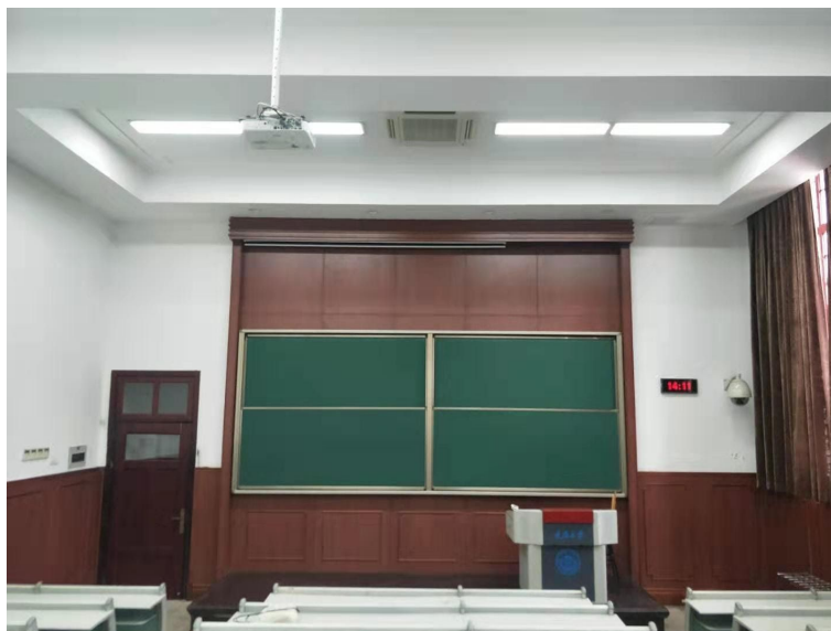
圖 13：重慶大學第五教學樓階梯教室和講台