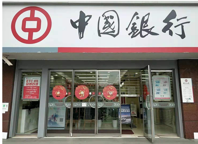
圖15：台灣學生可到這家中國銀行辦理銀行卡，位於重大A區大門正對面。