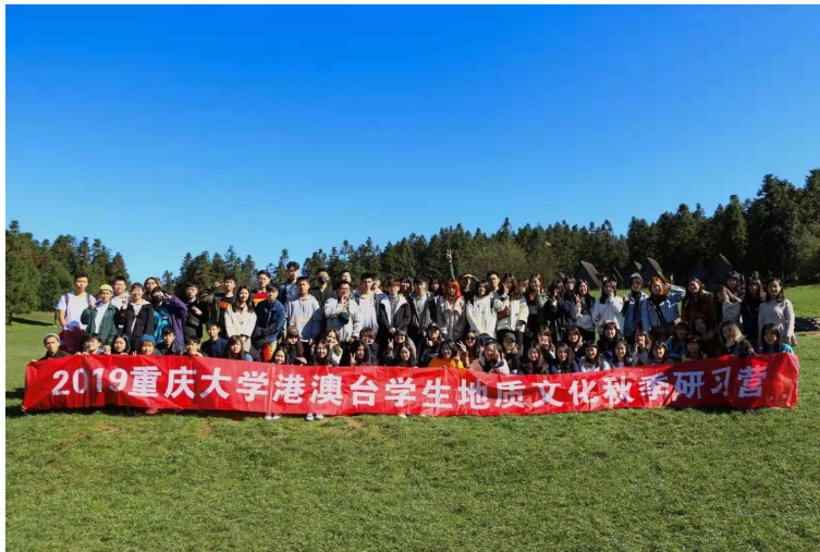
圖11：秋季武隆分學之旅所有參與的港澳臺學生