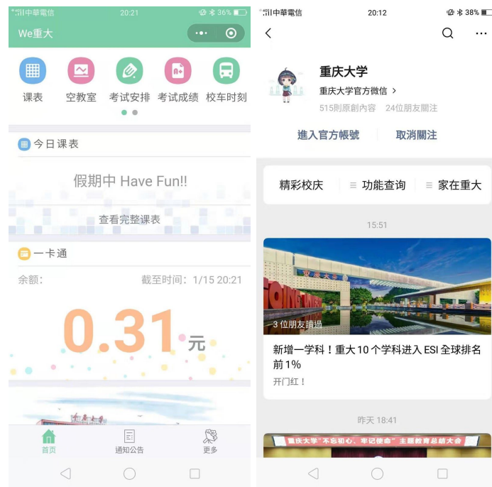
圖 12：左圖為WeCQU 微信小程序，右圖為重慶大學官方帳號