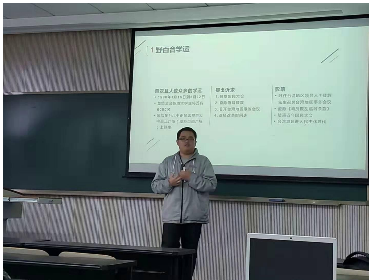
圖5：我在《鄉村與現代》討論課發表