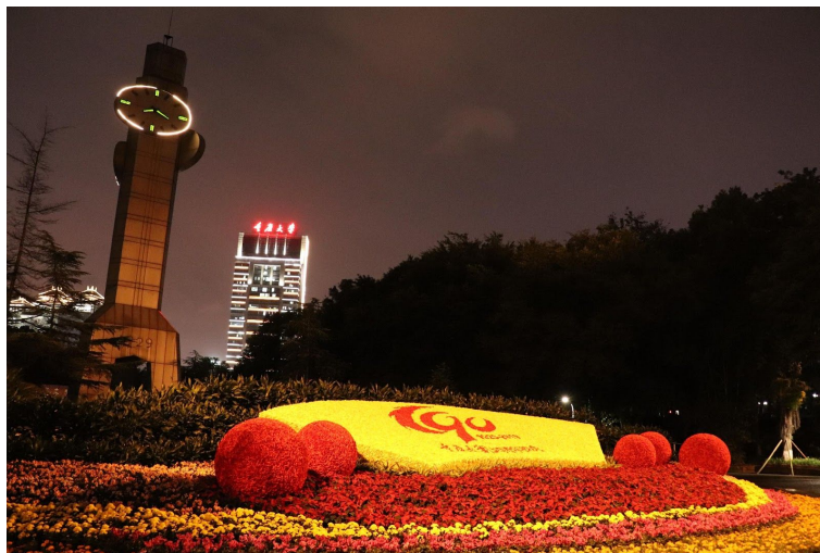
圖2：重大主教樓、鐘塔、90週年紀念花園

經過這半年的交換學習，重大給了我很多知識和事物，讓我受益良多，我在學術研究上又更上一層樓了，我希望重慶大學能秉持著當初創校的理念：「研究學術、造就人才、佑啟鄉邦、報導社會」繼續培育更多有才學的人貢獻重慶、中國大陸和世界所有地方，透過這些重大培育出有才學的人幫助重慶、中國大陸及世界上所有地方建設發展，讓重大的正向名聲能名揚四海，傳遍五大洲，讓全世界所有人知道在這世界上有一所培育出許多優秀人才的好大學叫作——重慶大學。