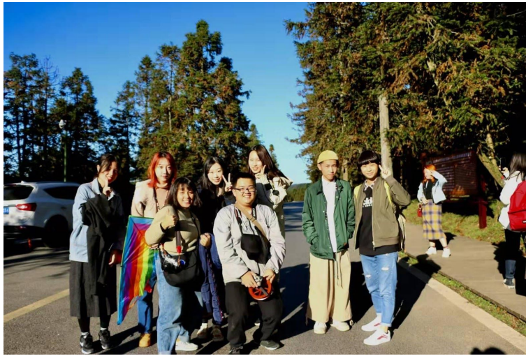
圖10：秋季武隆分學之旅第五小組