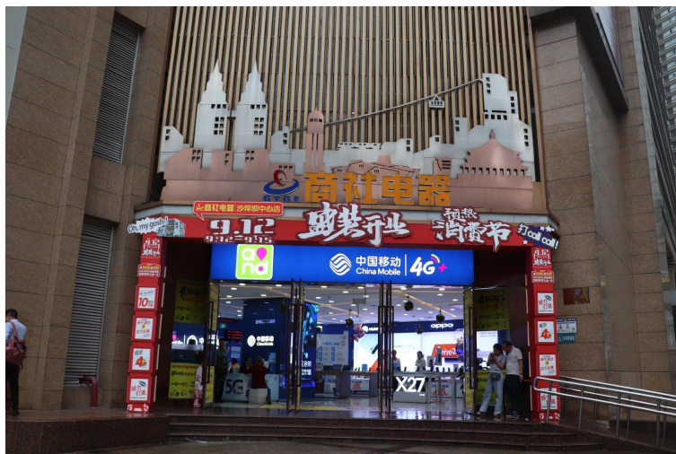
圖14：台灣學生可到這處中國移動辦理手機卡，位於三峽廣場、永輝超市旁。

6) 至大陸交換學習一定會與大陸同學做聯繫，因此在交換之前，必須事先有以下帳號才好與當地大陸做聯繫，例如：QQ、QQ郵箱、WeChat、微博等，在中國大陸地區，有很多軟件都不能使用，因此想要與大陸同學做聯絡，通常要有以上幾個，前兩者是連結在一起，帳號密碼一致，大陸同學比較常用，一定要下載，另外有些時候要寄電子郵件或填寫電子郵箱，我建議就直接用QQ郵箱就可以，不要用Gmail，因為在中國大陸地區使用上會很麻煩，WeChat比較是商務人士用，大陸同學也會用，但是不常用，至於微博比較像是Facebook，用來看看最近的社會動態，了解大陸社會的各方面發展狀況。